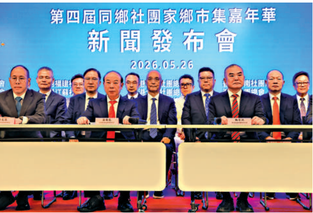
▲「第四屆同鄉社團家鄉市集嘉年華」籌委會昨日詳介本屆嘉年華亮點。

市民前往家鄉市集嘉年華，可從維園1號（告士打道）及6號（興發街）足球場入口進場。成人統一使用八達通入場，票價5元；身高1.2米以下的小童、持有樂悠咭的60歲或以上長者及殘疾人士，免費入場。