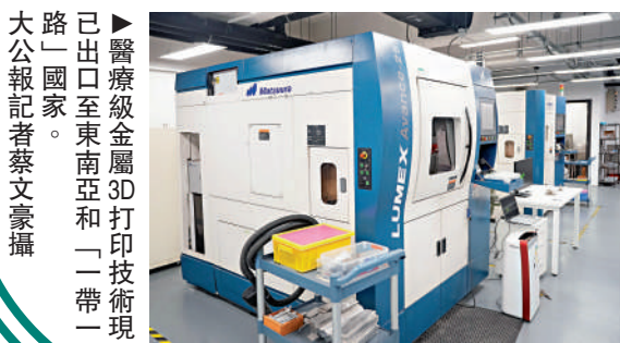
▲「醫工結合」理念，設計團隊與本港外科醫生合作無間，為患者提供度身定製的骨科植入物、手術導板及手術器械。

行政長官李家超將於6月初率領高規格代表團，出訪中亞兩國哈薩克斯坦及烏茲別克斯坦，推動香港與中亞經貿及創科合作。隨團的本港首間醫療級金屬3D打印企業創辦人於出訪前向傳媒表示，公司成立十多年以來，相關技術出口至東南亞及「一帶一路」國家。他又透露，近期與哈薩克斯坦簽訂新一輪合作協議，並冀望以此為樞紐，打開烏茲別克斯坦等其他中亞市場。