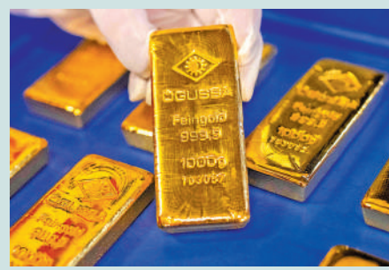
▲金價短線料於 4157 至 4690 美元區間上落。