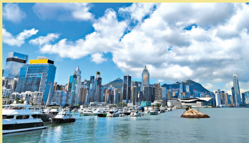
▲香港去年的跨境財富管理規模首度超過瑞士登頂。

算顯著，不過報告預計在2025至2030年間，香港管理的跨境財富規模將每年平均增長約9%，增幅較瑞士的6%為快，意味香港很大機會維持全球第一的地位。BCG預期到了2030年，香港的跨境財富管理規模將達到4.6萬億元，屆時與瑞士4萬億元的AUM差距將進一步擴大至6000億元。