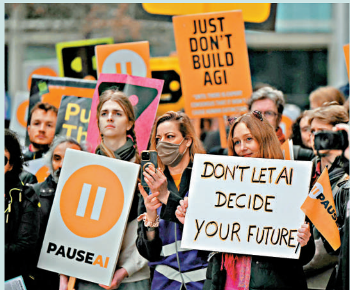
▲英國民眾今年2月在倫敦示威，抗議AI影響就業。