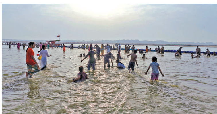
▲印度民眾27日在恆河中沐浴消暑。

或接近創紀錄的高溫水平，其中某一年氣溫打破2024年高溫紀錄，成為有紀錄以來最熱年份的幾率高達86%。