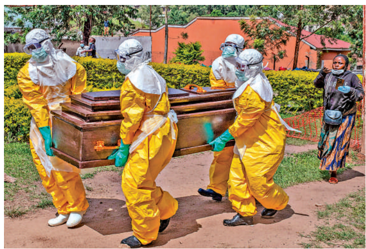
▲紅十字會僱員26日在剛果（金）運送一名感染伊波拉身亡的醫生遺體。

【大公報訊】據CNN報道：非洲新一輪伊波拉疫情持續擴散，剛果（金）27日發布的報告顯示，該國疑似病例數已破千。美媒爆料稱，美國政府計劃在肯尼亞修建一處臨時設施，用於隔離在剛果（金）有感染風險的美國公民，而不是讓他們返回美國。此消息引發巨大爭議。