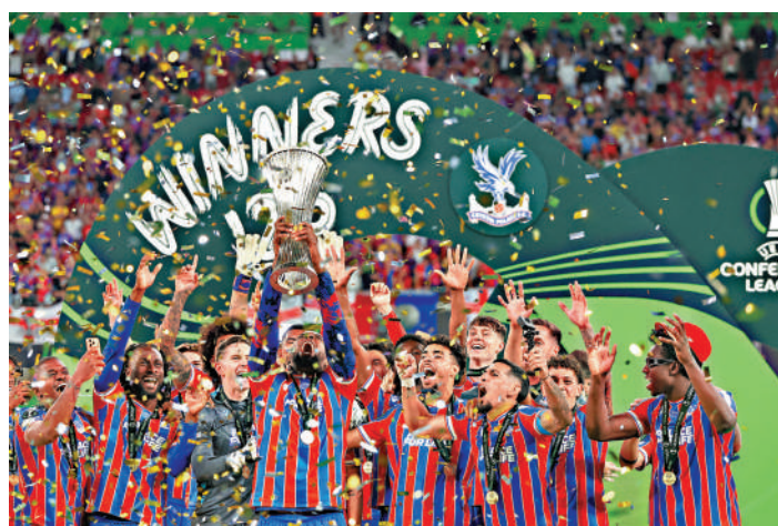
▲水晶宮球員出席歐協聯領獎儀式。

賽；下月底便年滿29歲的桑馬迪達，在去年10月才首度代表法國以後備上陣，之後在2場世盃外擔任正選中鋒都有「土哥」，僅代表3次便入2球，似乎頗為適合主帥迪甘斯的踢法。事實上他與已退役的基奧特都屬於「禁區內前鋒」類型，擅長作為支點，接應傳中直接攻門、二傳或伺機補射，今仗就展露了其中一面。