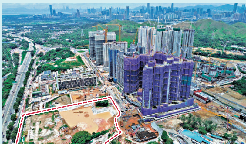
►體藝館座位數目約1萬個。