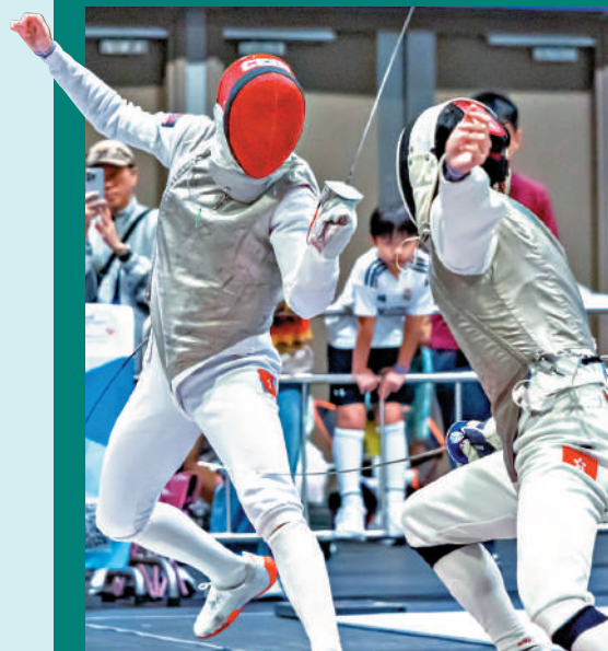
▲亞博館7月會舉辦世界劍擊錦標賽。

立法會議員霍啟剛日前在社交媒體發文，表示古洞北劍擊館約1000個觀眾席座位的規劃，與中國香港劍擊總會提出的6000個座位相差甚遠，不能滿足舉辦大型國際性劍擊賽事的實際需要。體育專員蔡健斌昨日就場館定位與規模表示，根據過往經驗，在亞洲國際博覽館舉行的國際劍聯花劍世界盃，總觀眾人數約為2700人，反映一般大型賽事的觀眾規模大約在2000人左右。