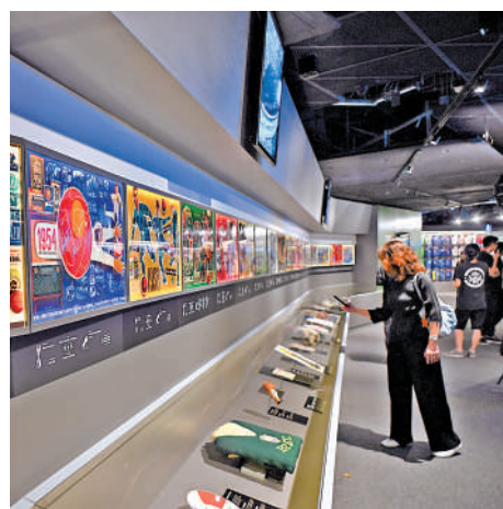
◀FIFA博物館特別展覽在銅鑼灣時代廣場舉辦。

有關世界盃的稀有珍藏則有1938年世界盃獎牌、首個官方FIFA吉祥物「Willie」，首支世界盃官方主題曲《Un'Estate Italiana》的原始黑膠唱片等。展覽更設有世界盃專屬比賽用球展牆，展出從1970年至今每屆官方指定比賽用球的演變史，結合原始展品、殿堂級獎盃、沉浸式多媒體互動裝置，以及由FIFA博物館精心編排的動人故事，呈現這項全球最大型體育盛事的设计美學。