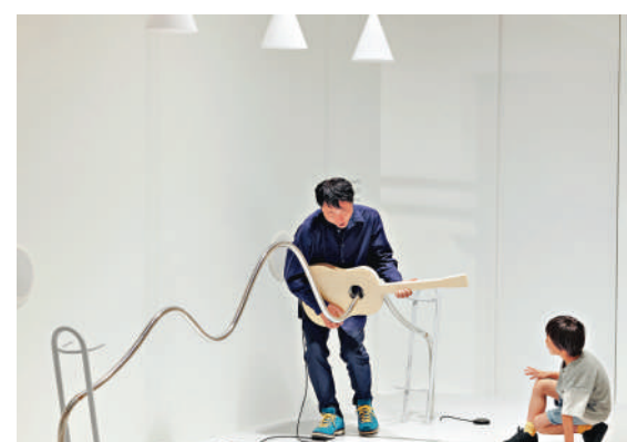
▲M+博物館6月27日起呈獻特別展覽「設計啊!感受日常設計之奇妙」。

本放送協會(NHK)製作的教育電視節目《Design Ah! neo》，而展覽是由NHK Education Corporation、NHK Promotion Limited和TOKYO NODE共同製作，展現出設計如何提升我們的生活品質、塑造日常行為，並促進人與人之間的聯繫。此特別展覽將於6月27日(星期六)至2027年1月10日(星期日)在M+地下大堂展廳舉行。