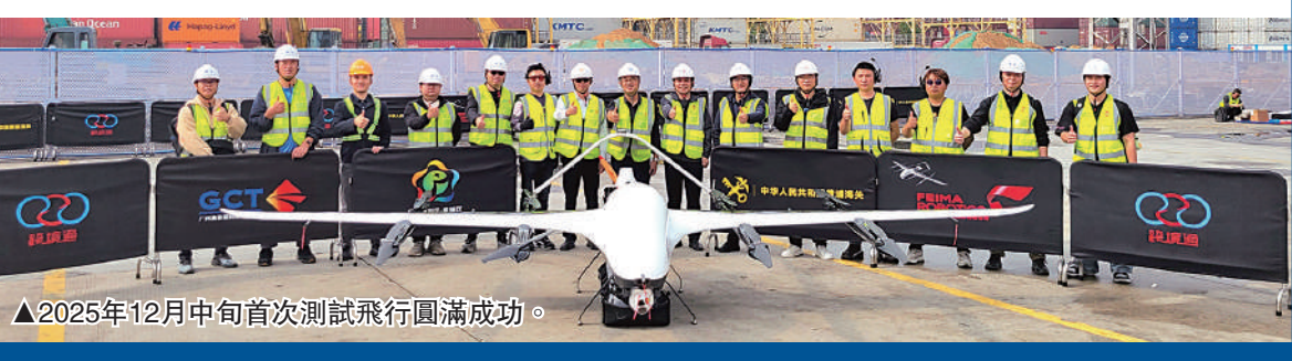
▲2025年12月中旬首次測試飛行圓滿成功。

知情人士透露，該公司正與中國銀行、中金公司等機構合作籌備，具體IPO時間尚不確定。