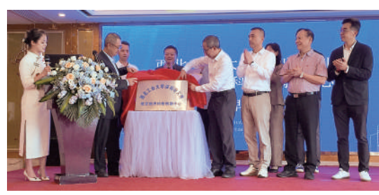
▲西工大深圳研究院與廣州跨境通合作的低空經濟科技創新中心正式授牌。

此外，廣州跨境通正式授權澳門神行航空擔任澳門區域跨境飛行代理機構，標誌粵港澳三地低空通航全域布局完成關鍵一環。雙方將深度整合澳門