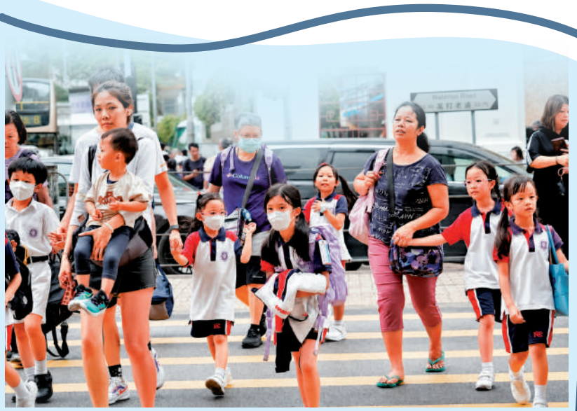
▲2026年度小一統一派位將於下周三、周四公布結果，整體滿意率為93.6%。

教育局將於下周三公布今年度小一統一派位結果。家長除可在當日早上10時起，透過「小一入學電子平台」查閱結果，教育局亦會在下周二至四，透過郵遞或短訊方式通知家長。