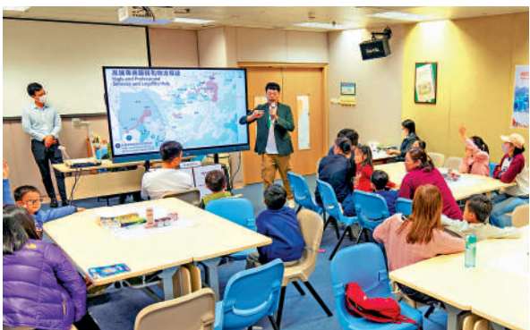
▲北都辦在本學年走訪了全港10多間中學，接觸過千名師生，講解北都發展藍圖。

此外，北都辦與職業訓練局轄下的香港專業教育學院、香港建造學院、公共圖書館及非政府組織等合作，透過講座或導賞，讓不同年齡層（由小