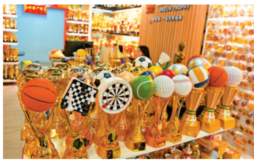
▲義烏國際商貿城這家商戶專門銷售體育比賽獎盃。

國際足聯主席因凡蒂諾解釋，世界盃是國際足聯的主要收入來源，即在一個月的賽事期間賺到接下來47個月的錢。商業分析人士指出，門票收入在國際足聯的商業化版圖