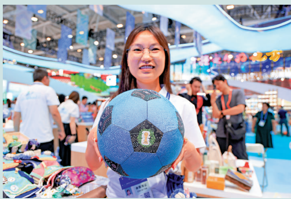
▲世界盃周邊商品迎來銷售旺季，圖為深圳文博會上，工作人員展示廣西壯錦與世界盃合作的文創產品。