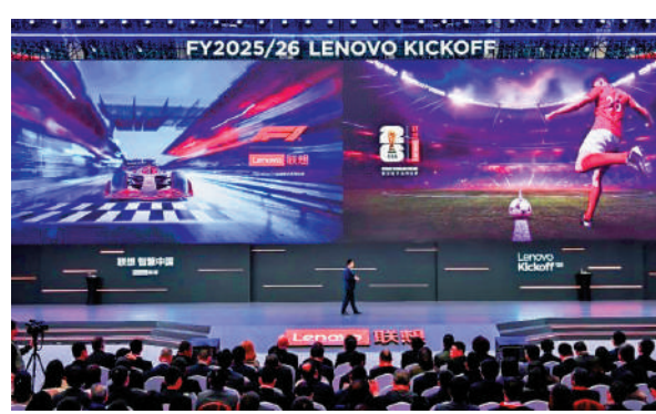
▲聯想將在世界盃期間引入VAR 3D數字人可視化方案。

高盛指出，該公司電腦硬件業務增幅仍跑贏大市，市佔率顯著提升，利潤率雖然受近日儲存記憶體價格急升，仍能保持穩定；此外，集團人工智能伺服器業務單價持續提升；加上公司AI智能代理（AI Agents）涵蓋企業和個人用戶，三大亮點均令市場有驚喜，故將目標價由12.53元，大幅上調至27元，維持「買入」評級。