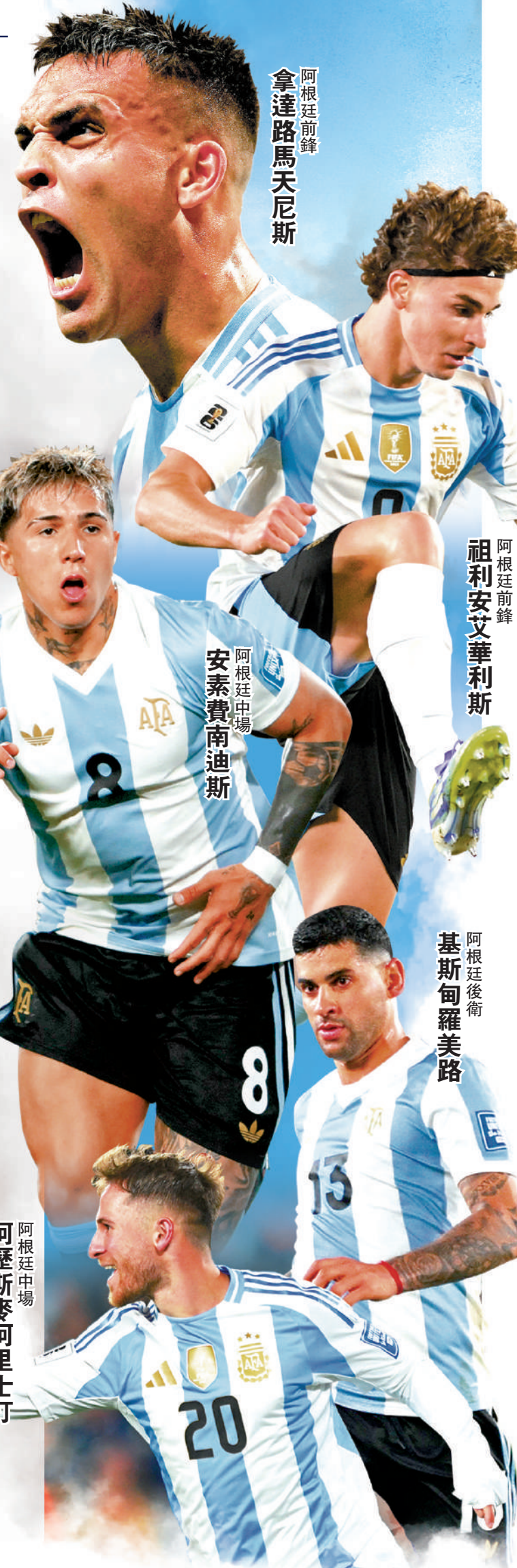
阿根廷前鋒 拿達路馬天尼斯