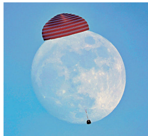
▲5月29日，神舟二十二號載人飛船返回艙與月球同框合影。