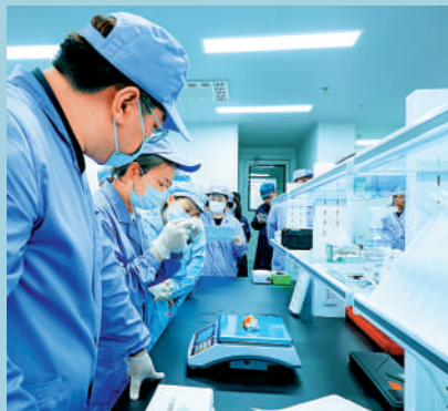
▲中國空間站第十批空間科學實驗樣品經檢查確認後，將交付科學家開展後續研究。