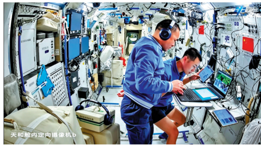
▲神舟二十一號航天员乘組駐留中國空間站期間，持續開展多項實驗。

神舟二十一號航天员乘組5月29日乘坐神舟二十二號飛船返回地球，圓滿結束為期7個月的太空之旅，他們於30日乘坐飛機平安抵達北京。