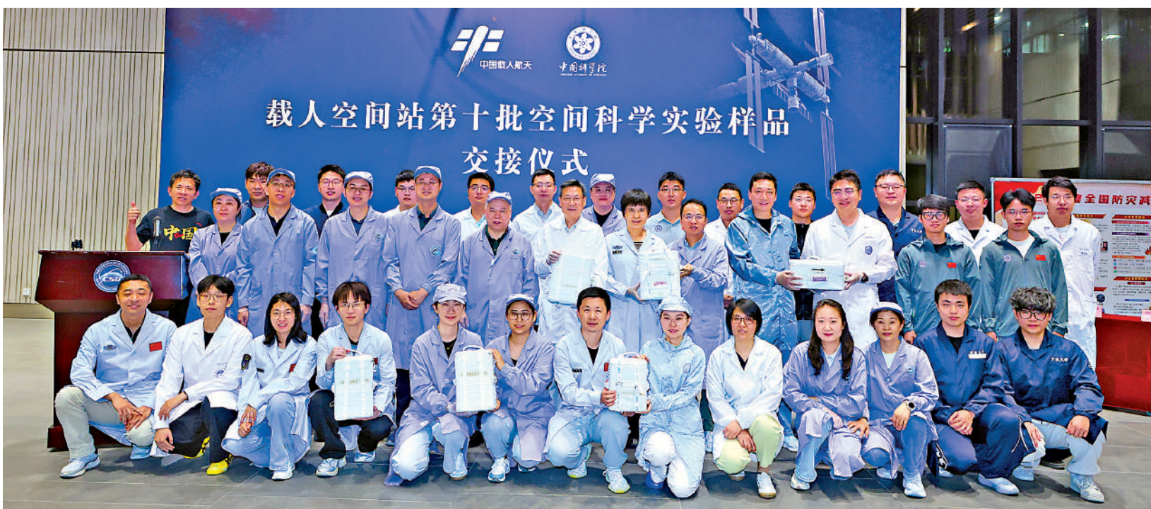
▲5月30日，人工胚胎等中國空間站第十批科學實驗樣品隨神舟二十一乘組順利返回並交付科學家。

在材料科學領域，新型鈦合金、高強韌鋼、弛豫鐵電單晶等材料類實驗樣品返回後，科學家將對空間樣品進行組織形貌、化學成分及其分布差異等測試分析，研究重力對材料生長、成分偏析、凝固缺陷及性能的影響規律。研究成果將為指導新型合金的性能優化，以及高性能壓電/鐵電功能晶體、高強韌結構鋼等關鍵材料的地面製備提供技術支撐，助力其應用於航空航天、高端裝備製造、精密傳感與醫療超聲成像等領域。