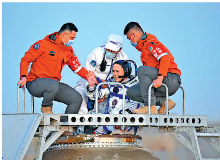
▲5月29日，載着神舟二十一號航天员乘組的神舟二十二號載人飛船返回艙在東風着陸場成功着陸。圖為航天员乘組指令長張陸出艙。