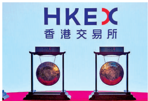
▲周嘉恆建議進一步優化《上市規則》第18C章節。