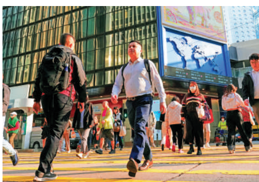
▲香港推出利好措施吸引高淨值人士來港。

潘宗杰並建議，可以將家族辦公室的免稅範圍擴大至藝術品，有助推動香港成為藝術品交易中心，同時將合資格單一家庭辦公室的稅率降低（例如8.25%），條件為增加合資格僱員及每年營運開支總額，分別較「實質活動要求」的不少於2名及不少於200萬元更高，相信有助吸引單一家庭辦公室來港擴大業務。