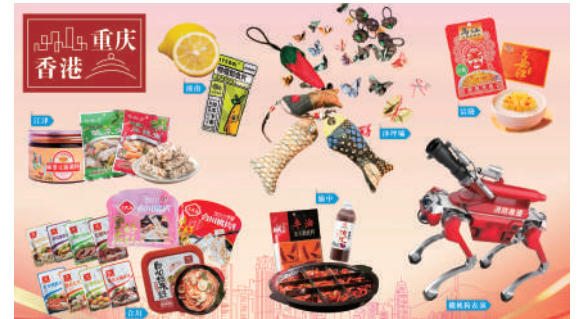
▲香港重慶總會於家鄉市集嘉年華帶來重慶六大區縣的特色產品，讓市民們感受重慶文化的創新與活力。