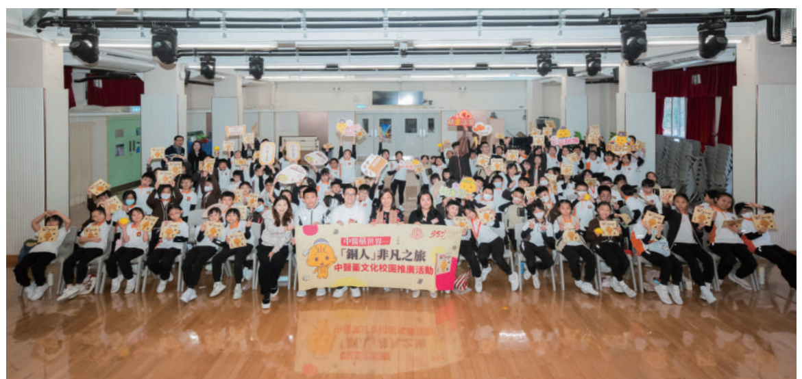
▲《「銅人」非凡之旅》到訪香港小學，為學生帶來充滿趣味的中醫藥啟蒙之旅。

活動還特別安排了學生們在「北京同仁堂中草藥園」裏進行種植體驗，在園藝師及導師帶領下，學生們一起參與「移苗種植」體驗活動，親身觀察草本植物與動手體驗種植，透過實地體驗不僅提升了成就感，更加深了他們的學習印象。這種寓教於樂的方式，讓中醫藥文化在新一代的生活中扎下根基，同時