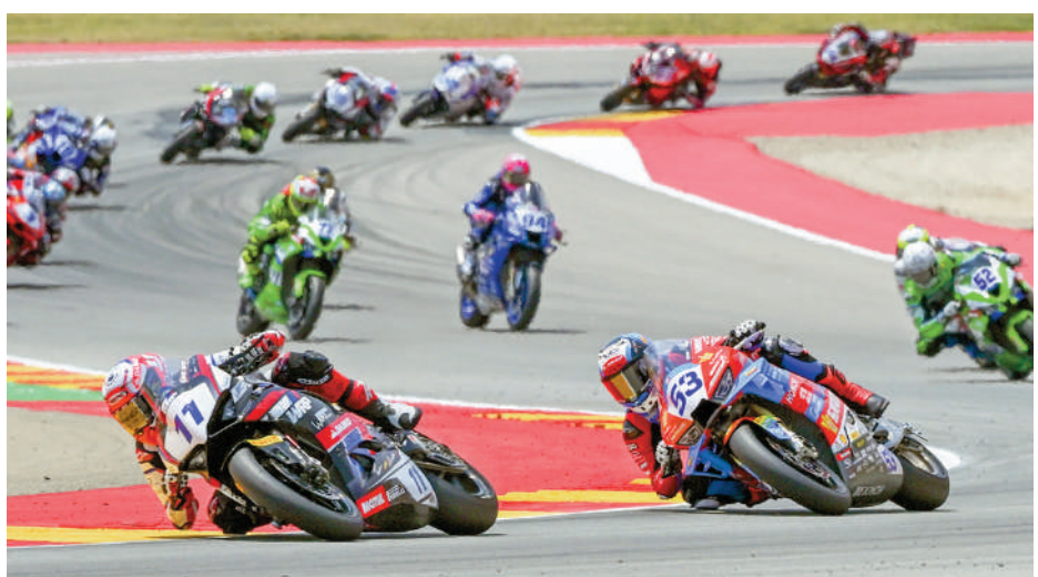
▲迪比斯（左二）在比賽中。