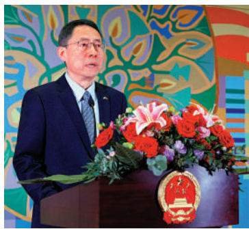
▲中國駐哈薩克斯坦大使韓春霖表示，李家超行政長官率團訪哈，有助港企深耕中亞市場、推動中亞國家把握香港機遇。

行政長官李家超昨日率領高規格商貿代表團抵達哈薩克斯坦首都阿斯塔納。中國駐哈薩克斯坦大使韓春霖在李家超抵埗前接受《大公報》專訪，祝願代表團此行取得圓滿成功。韓春霖表示，李家超行政長官此次率領高規格代表團訪哈，必將開啟香港同哈薩克斯坦及中亞國家互利合作的新篇章。此訪將為「東方之珠」與「草原之國」構築起合作橋樑，促進兩大區域樞紐的直接對接。這不僅有助於港企深耕中亞市場、推動中亞國家把握香港機遇，也能讓香港發揮「一國兩制」優勢、區位資源稟賦和「內引外聯」作用，帶動內地各界深化對哈合作。