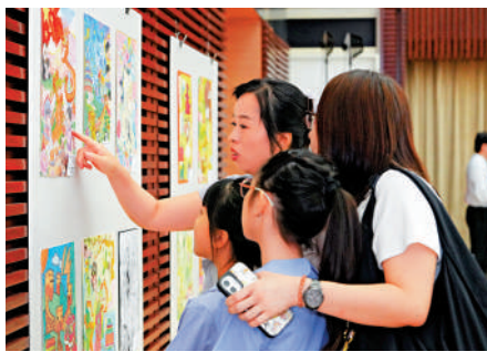
▲學生和家長參觀獲獎作品。

畫上圓滿句號。本次大賽由香港書畫藝術導師協會、新界校長會、香港島校長聯會、九龍地域校長聯會、香港直接資助學校議會、香港資助小學校長會等多家教育及藝術團體協辦，並獲得文匯報、大公報、點新聞、中國日報香港版、香港商報、香港中通社、中新社香港分社、鏡報、知識雜誌、廣東電視台香港記者站、羊城晚報報業集團香港記者站等十餘家主流媒體支持。