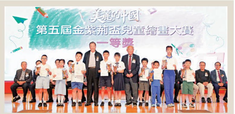
▲主禮嘉賓為一等獎獲獎學生頒獎。

本次大賽以「美麗的中國」為主題，自3月啟動以來得到兩地教育界及藝術界的廣泛響應，共收到數千幅充滿童真與創意的參賽作品。經過評審團嚴格公正的評選，最終評選出一等獎10名、二等獎20名、三等獎30名及優異獎60名。