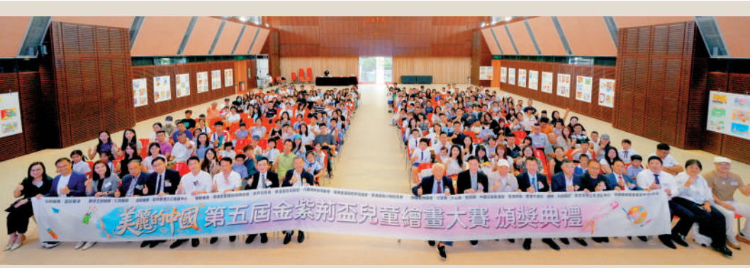
▲「美麗的中國」第五屆金紫荊盃兒童繪畫大賽頒獎典禮昨日舉行。