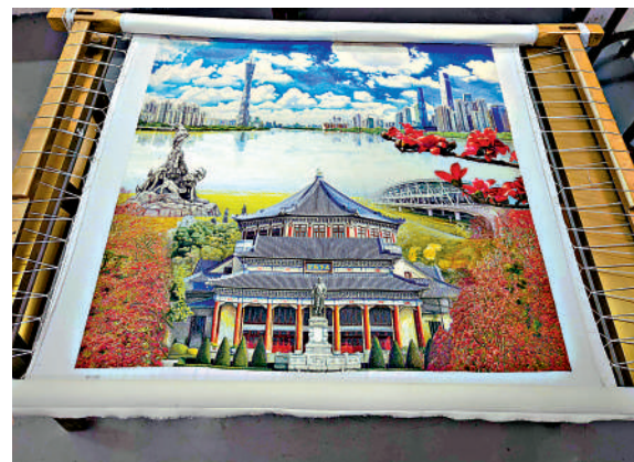
▲王新元創作的廣州題材作品。