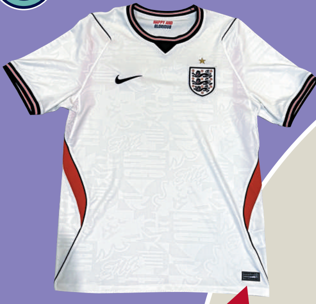
現時新款國家隊或球會球衣均有防偽特徵，方便顧客核實。