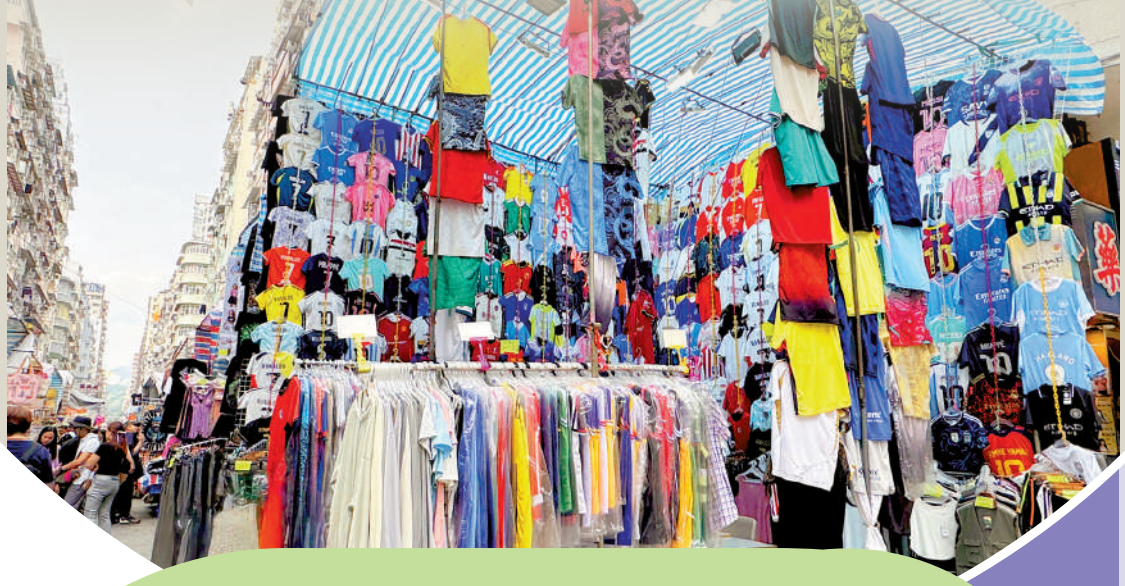
▲2026世界盃將至，大公報記者發現，旺角女人街多個攤檔，公然陳列逾二百件冒牌球衣。

大公報記者近日到旺角通菜街觀察，發現有攤檔售賣球衣，其中一檔位處街口，附近人來人往，展示逾200件球衣，各國款式應有盡有，一名黑衫男店員介紹，所有球衣連褲套裝售160元，若購買兩套特價250元，價錢與正版相距甚遠，明顯是冒牌貨。