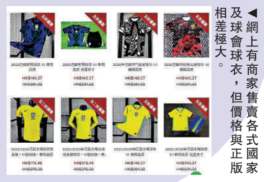
▲網上有商家售賣各式各樣及球會球衣，但價格與正牌相差極大。

上屆2022年世界盃期間，香港海關展開連串打擊冒牌球衣行動，其中一次在深圳灣及港珠澳口岸透過X光儀器，發現有假冒球衣混集在多架貨車的貨物內，共檢獲92000件冒牌球衣，估價值4600萬元，14名男子被捕。大公報記者 姚棠