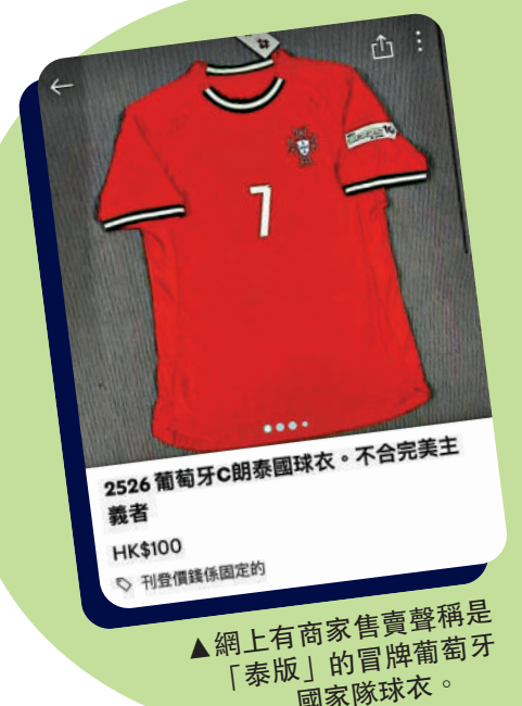
2526 葡萄牙c朗泰國球衣。不合完美主義者 HK$100 刊登價係個定的