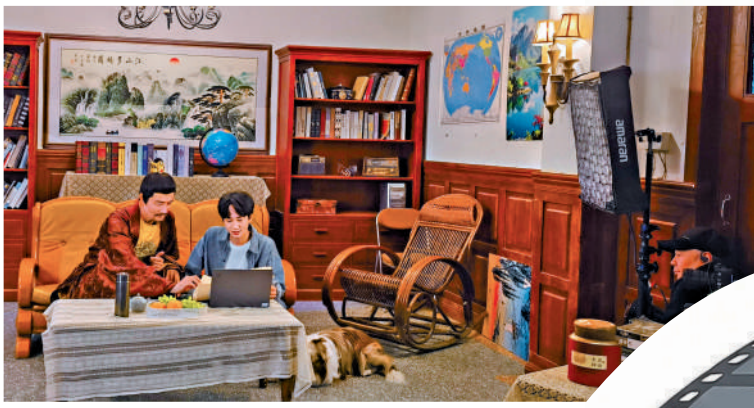
組在鄭州的大志影視基地進行拍攝。