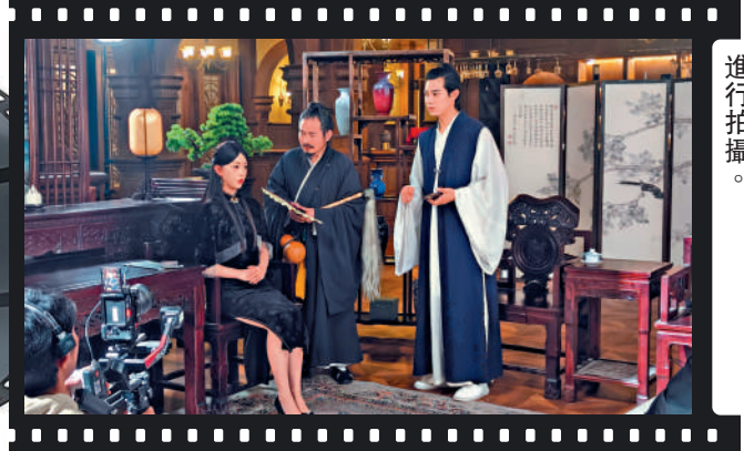
大陸短劇市場興旺。圖為劇組在鄭州的大志影視基地進行拍攝。