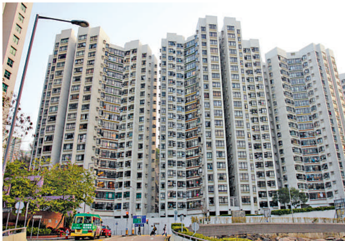
▲康怡花園有2房單位估價今年累升約18%。

差估署樓價指數連升11個月，大型屋苑身價隨大市上揚。大公報抽選20大屋苑單位於恒生銀行進行估價，涉及1房至4房戶型，實用面積由327至975方呎，截至5月底止，今年有半數升幅已達1成或以上，其中康怡花園R座低層10室2房單位，實用面積466方呎，去年12月底估價只有570萬元，今年2月重上600萬元，最新已獲上調至671萬元，短短5個月之間累升101萬元，升幅達17.7%。