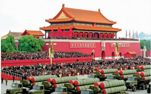
▲1999年新中國成立50周年國慶閱兵中，導彈裝備方隊通過天安門廣場。

20世紀90年代，面對世界新軍事變革風起雲湧，黨中央和中央軍委提出「政治合格、軍事過硬、作風優良、紀律嚴明、保障有力」的軍隊建設總要求，推進中國特色軍事變革。