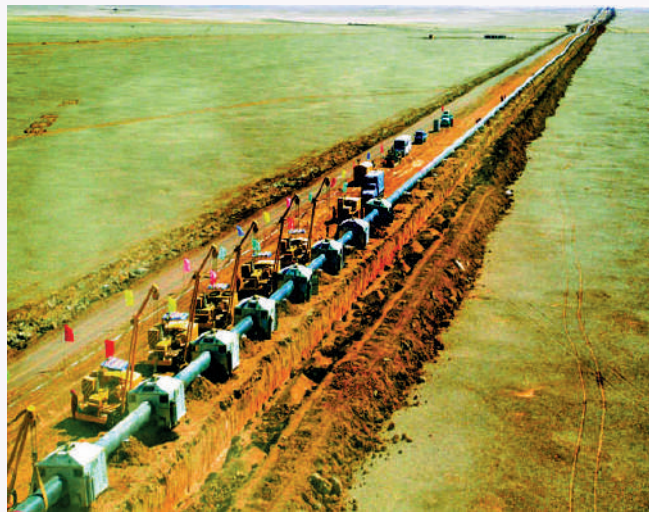
▲西氣東輸工程於2000年正式啟動，2002年7月4日動工建設。