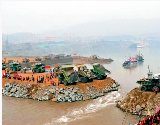
▲1997年，三峽大壩圍堰截流合龍現場。