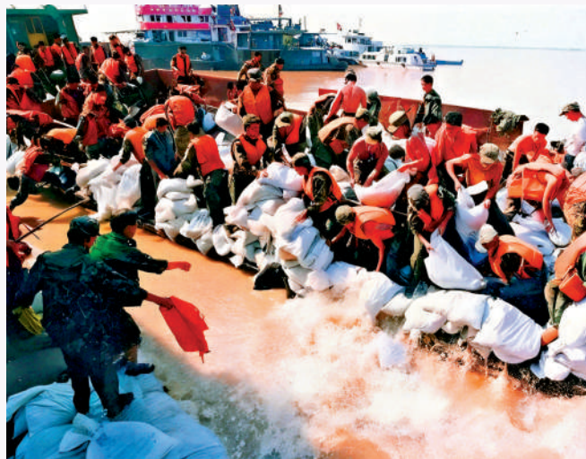
▲1998年夏，人民解放軍和武警部隊官兵奮力抗洪搶險。