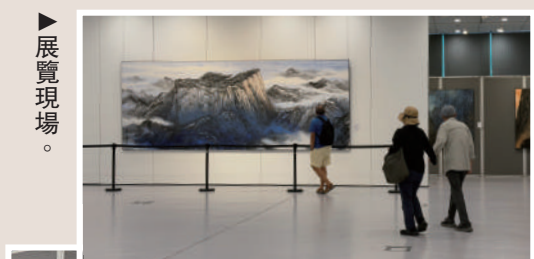
▲香港市民在萬鼎履歷展前。