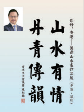
▲香港立法會議員陳紹雄先生為展覽題詞

萬鼎先生為中國美術家協會理事、中國國家畫院研究員、巴黎高等藝術學院客座教授。其作品《看山還看祖國山》陳列於人民大會堂。