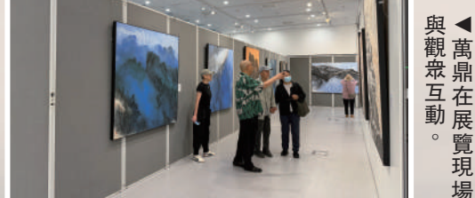
▲萬鼎在展覽現場與觀眾互動。