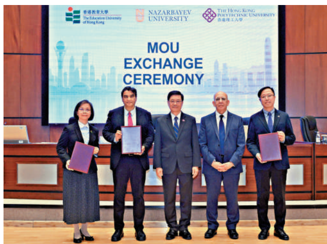
▲行政長官李家超與校長瓦卡爾教授，見證兩地高校交換合作備忘錄和合作協議。