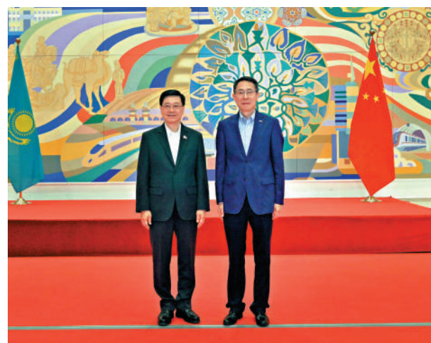
▲行政長官李家超與駐哈薩克斯坦共和國特命全權大使韓春霖合照。