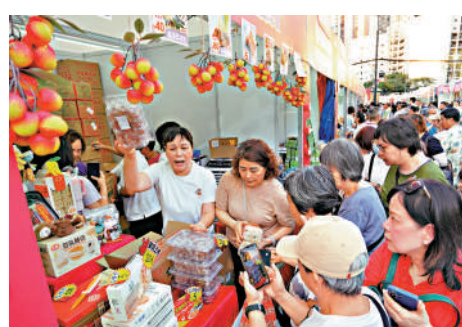
▲不少市民及遊客選購特產乾貨。