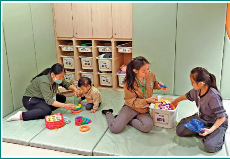
油麻地社區客廳設有兒童遊戲室。