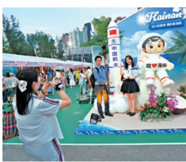
▲有市民和遊客在中國航天打卡位前合影留念。