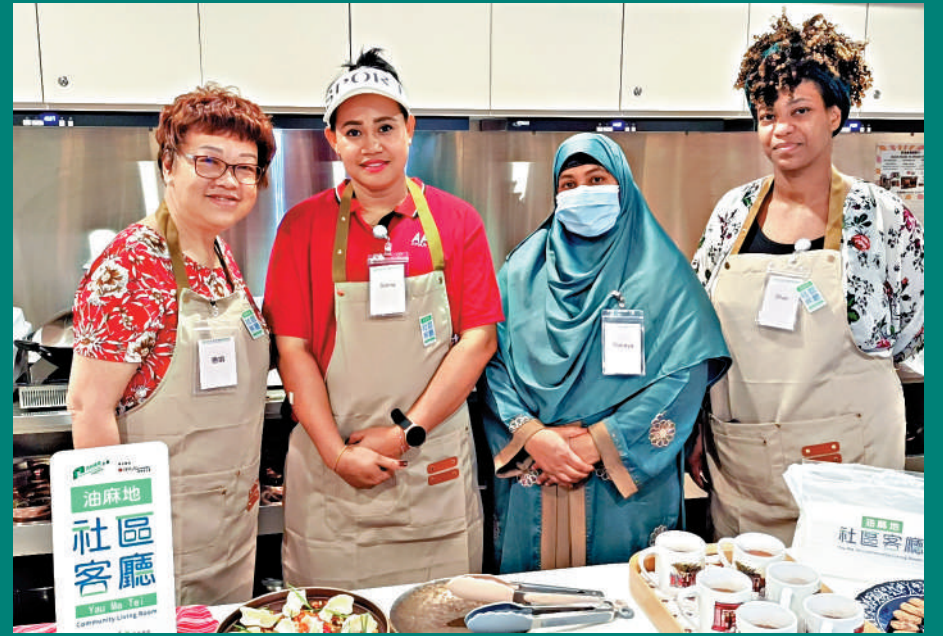
油麻地社區客廳專門為少數族裔人士提供清真備餐區，便利不同文化及宗教背景的居民。

本港已投入服務的13間社區客廳，主要位於油尖旺、深水埗、中西及紅磡等地區。民建聯立法會議員鄭泳舜昨日在立法會大會提問，會否在現時未覆蓋、但劏房住戶較集中的地區設立社區客廳。民建聯議員陳克勤引述政府數字表示，現時社區客廳主要集中在九龍區，大埔區、沙田區的劏房分別約有3500個和1500個，卻未有社區客廳。