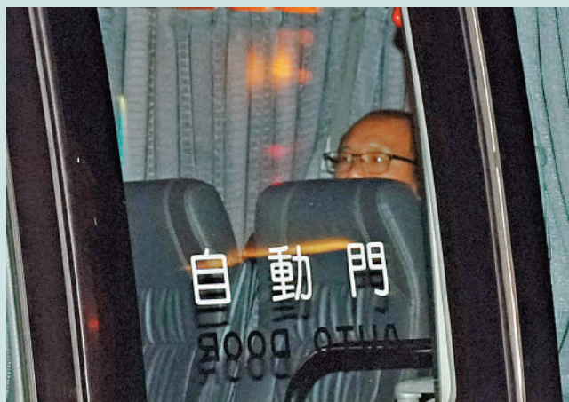
▲「非常父親」昨晚獲准保釋。

當區區議員、立法會議員張培剛接受《大公報》訪問時形容，事件令人匪夷所思，讚揚政府迅速介入，做法非常正確，期望家長二人能夠了解法律，讓孩子在正確的思想教育下成長。