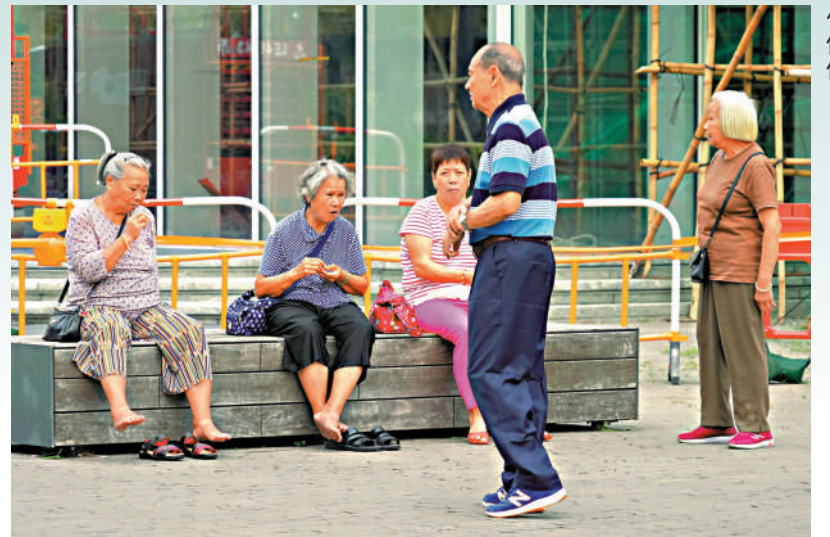
▲香港人平均壽命增加，相應也需要更多的退休儲備。

香港退休計劃協會昨日公布《賦能勞動人口 強化退休保障》研究報告。研究根據香港統計署及消費者委員會的數據，將基線退休開支定為每月2萬元，以65歲男性退休人士為例，按預期壽命86歲計算，維持基線生活開支需要460萬元；女性預期壽命達90歲，則要540萬元。若要建立90%信心水平，假設男性規劃至97歲，需儲蓄660萬元，女性規劃至100歲，則需儲蓄710萬元。報告指出，人口老化與生活成本上升交織，令退休財務規劃更具挑戰。