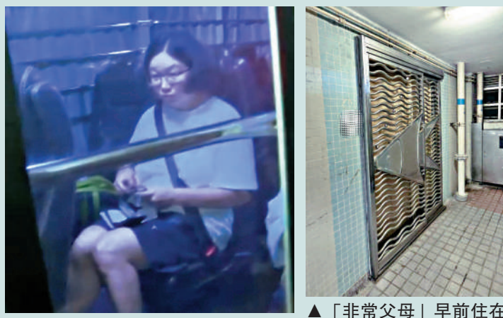
▲「非常母親」昨晚亦獲准保釋。電視截圖