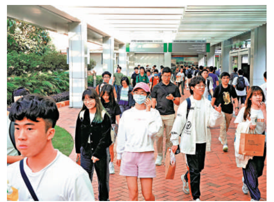
▲人工智能科技高速發展，對青年就業有深遠的衝擊。