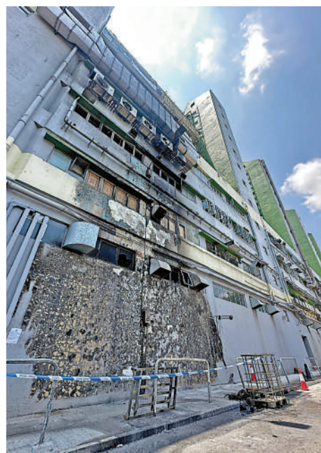
▲葵涌葵德工業中心火警疑涉非法入油活動。