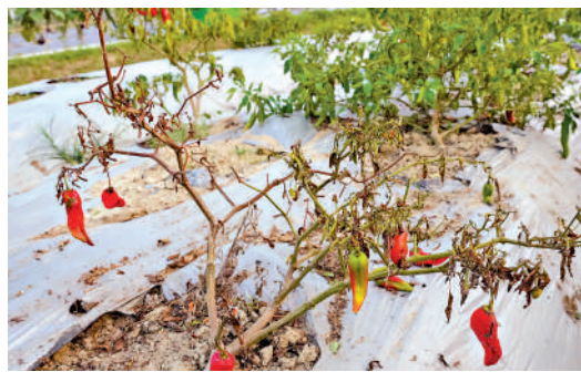
▲不少農作物難抵酷熱被「曬死」。

機廢物，以改善水質及溶氧量。陳博智舉例稱，暴雨過後，農作物或在兩至三日後才陸續枯萎死亡，建議漁護署在每次極端天氣後，延長視察期至最少兩至三日，進行持續跟進視察，確保農戶損失得到全面、準確的評估。同時，坪峯一帶農田易受水浸，他建議政府研究改善該區的排水設施，減低暴雨帶來的農業損失。