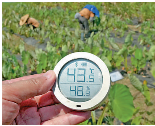
▲望原農場工友在近44度高溫工作。

漁農界立法會議員陳博智向大公報記者表示，極端酷熱、暴雨及颶風的天氣愈發頻繁，本港漁農業面對的挑戰是多方面、複合式的，包括農作物失收、禽畜患病、應激及死亡風險上升等。他建議政府擴大漁農業資助計劃的範圍及金額，涵蓋豬農灑水降溫系統、農業溫室遮光設施等防熱設備，協助農戶應對持續酷熱天氣；並加強清理海上養殖區海床積聚的有