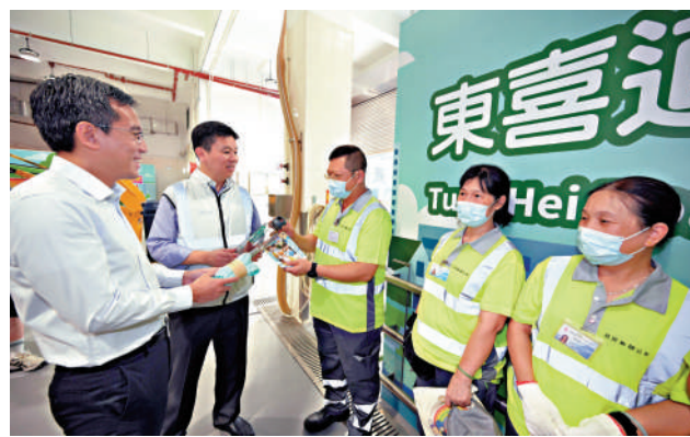
▲勞工處和食環署代表向工友派發消暑用品。

【大公報訊】記者肖泓宇報道：勞工處昨日聯同食物環境衛生署代表到訪筲箕灣一個公眾垃圾收集站，向前線清潔工友派發清