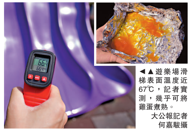
▲遊樂場滑梯表面溫度近67°C，記者實測，幾乎可將雞蛋煮熟。