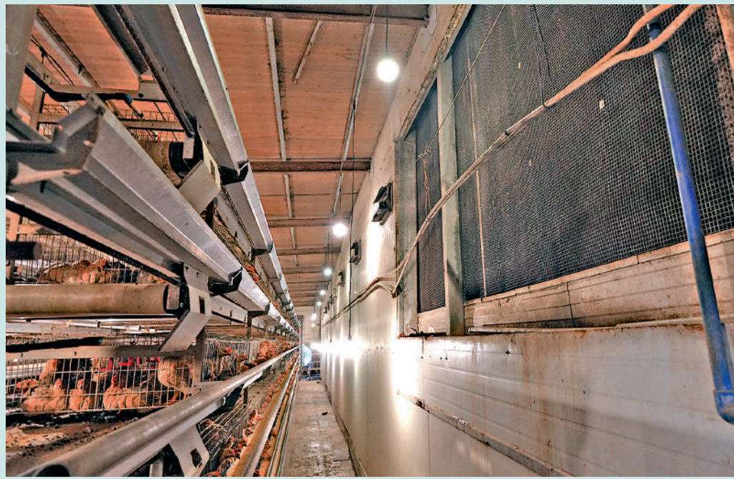
▲雞場設有調溫系統，成本大增。

天文台於6月2日清晨發出的酷熱天氣警告，至昨日仍然持續生效。網上不少人分享拍攝到的高溫照片，有網友近日於上水室外溫度表見到錄得42度高溫，有人展示車載溫度表錄得外部溫度高達38.5度。天文台昨日於上水錄得氣溫高達37.2度，天文台表示，受南海東北部熱帶氣旋的下沉氣流影響，預料今日本港部分地區極端酷熱。