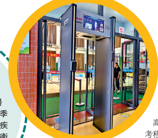
▲廣州市某高考考點設立升級版的智能安檢門。