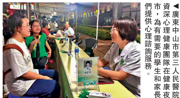
▲廣東中山市第三人民醫院資深心理健康團隊在健康夜市提供心理諮詢服務。

多位相關醫生亦建議，考生和家長不必「迷信」高壓氧艙所謂的「提升記憶力」的功效。高壓氧治療雖然能改善大腦生理狀態，但它無法直接提高分數。很多時候，是家長把自己的擔憂投射到了孩子身上，進而急於尋找各種「特殊手段」。日常生活中，幫助考生緩解疲勞、科學減壓的方法其實有很多，比如保證睡眠、定期進行有氧運動、多去戶外曬曬太陽，都能有效排解壓力。但要特別警惕的是，不要迷信所謂的「備考神器」，大多數是心理安慰劑，缺乏實質的證據。與其依賴外物，不如調整作息。