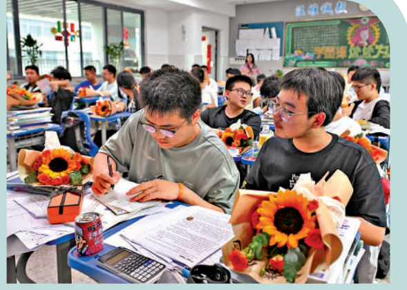
▲近日，在合肥一中瑤海校區，高三年級學生迎來高考前的「最後一課」。