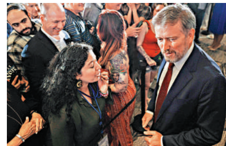
▲共和黨籍聯邦眾議員馬西(右)多次與特朗普唱反調。

●自2月底對伊朗開戰以來，這是眾議院第四次就相關決議草案進行表決，此次是首次通過決議。