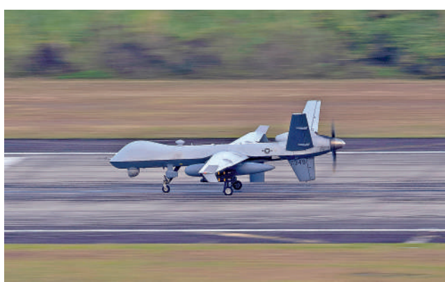
▲美國或大幅削減向北約提供戰鬥機、無人機等裝備。圖為美軍MQ-9無人機。路透社

美方尚未公布調整計劃的具體細節。路透社援引軍事消息人士稱，根據美國的計劃，提供給北約的美軍F-15和F-15E戰鬥機數量將減少三分之一，降至99架；MQ-4和MQ-9無人機數量將減半，降至12