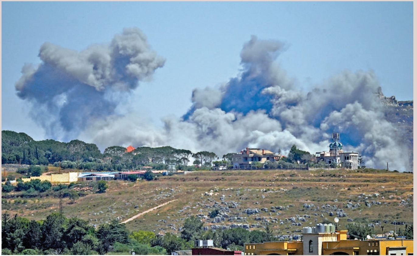
中東局勢仍未降溫。圖為以色列4日繼續空襲黎巴嫩南部地區。

伊朗最高領袖穆罕默德塔巴4日發表書面致辭，呼籲伊朗人民團結。他指出，敵人試圖通過散播懷疑、絕望、恐懼、猜忌的種子，來破壞伊朗人民的韌性並擾亂伊朗決策體系。