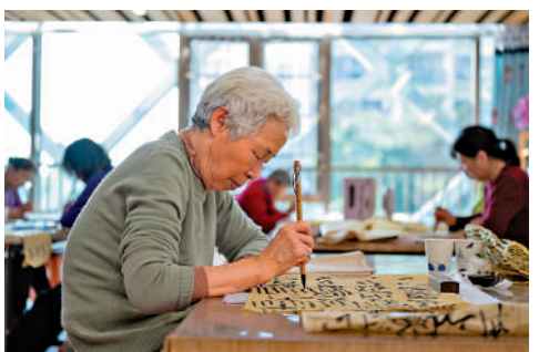
▲1月13日，長者在澳門街坊會聯合總會廣東辦事處橫琴綜合服務中心練習書法。

根據調查分析報告，澳門居民對合作區的創業就業環境和生活居住環境滿意度均超過80%。港澳居民在合作區的跨境執業專業人士已達1599人，其中執業註冊澳門醫療人員同比增長超過12倍。