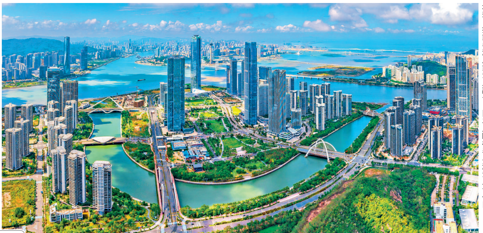
▲截至今年6月2日，橫琴粵澳深度合作區實有澳資企業數量突破8000家。「澳門註冊+橫琴生產」模式助力澳門品牌工業提質增效，推動琴澳產業深度融合。圖為鳥瞰橫琴粵澳深度合作區。