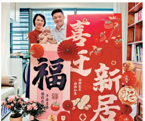
▲一家三口在橫琴澳門新街坊的家裏合影。

在合作區就業的澳門居民5952人，同比增長16.8%；生活居住的澳門居民24439人，同比增長26.2%；澳資經營主體超8000戶（截至2026年6月2日）。