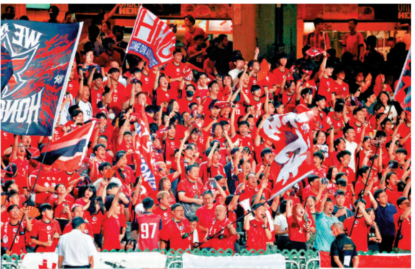
▼港足球迷為主隊球員吶喊助威。