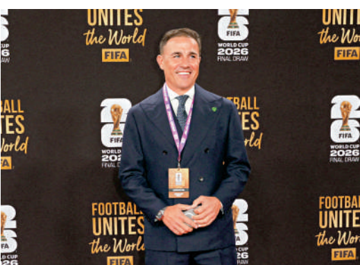
簡拿華路在2025年10月接掌烏茲別克斯坦帥印。

至於剛果民主共和國主帥迪沙布雷，他帶領球隊近年交出不錯的成績單，包括重返世界盃決賽周，因此目前帥位相對穩固。哥倫比亞主帥羅倫素同樣為球隊帶來不少戰術變化，並重整了球隊紀律，只要能如願取得出線資格，帥位便可高枕無憂。