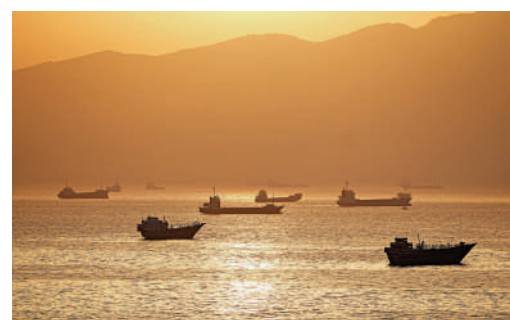
▲停在阿曼對出霍爾木茲海峽內的船隻。

伊朗媒體5日援引一名接近伊朗談判團隊的消息人士稱，沙特媒體有關「伊朗已同意將其部分濃縮鈾儲備轉移至第三國」的報道不實。該消息人士稱，目前伊美間的談判並未涉及核相關議題。