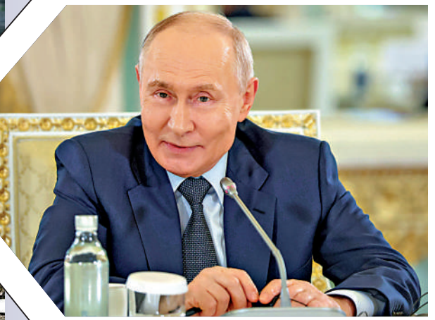
▲俄羅斯總統普京4日在聖彼得堡會見世界主要通訊社負責人。

俄羅斯總統普京4日表示，俄方願與烏克蘭在俄美安克雷奇會晤成果基礎上以和平方式達成協議。當天稍晚時候，烏克蘭總統澤連斯基公開致信普京，提議在第三國舉行面對面會晤以結束戰事。分析人士認為，由於目前俄烏在談判訴求上差距懸殊，即便普京與澤連斯基實現會晤，雙方也難以達成一項具有約束力的協議，至多能促進一些階段性、戰術層面的臨時停火安排。