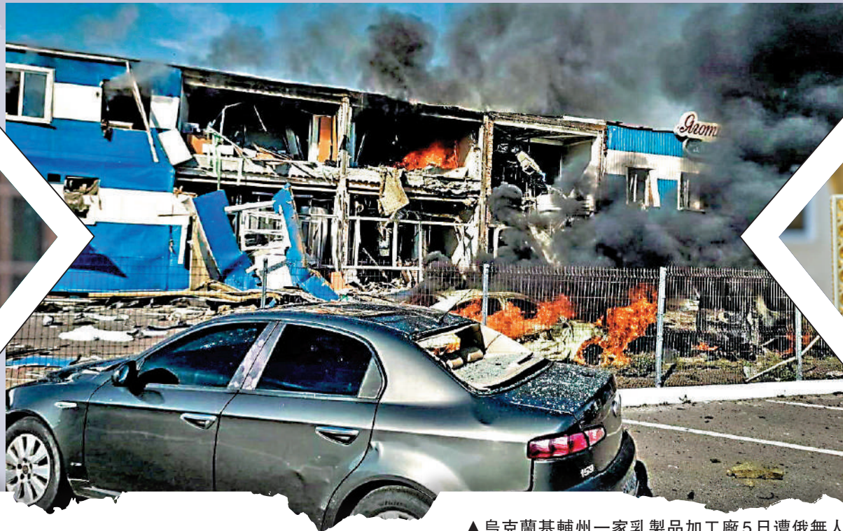
▲烏克蘭基輔州一家乳製品加工廠5日遭俄無人機襲擊起火。