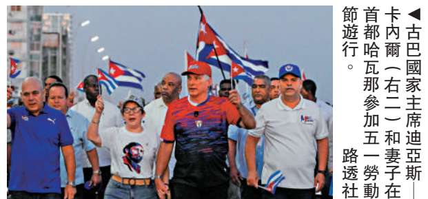
▲古巴國家主席亞斯-卡內爾(右二)和妻子(右一)參加遊行。

中國外交部發言人5日表示，美方變本加厲，升級對古巴封鎖制裁，公然列名古巴領導人，再次暴露恃強凌弱的霸權霸道嘴臉，中方對此堅決反對。中方敦促美方立即停止對古巴的封鎖和任何形式的脅迫施壓，停止侵犯古巴人民的生存權、發展權。中方將一如既往堅定支持古巴維護國家主權和安全，反對外來干涉。