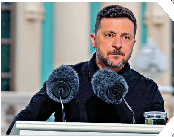
▲烏克蘭總統澤連斯基3日在基輔出席記者會。