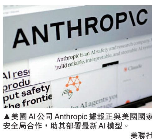
▲美國AI公司Anthropic據報正與美國國家安全局合作，助其部署最新AI模型。

《金融時報》援引兩名知情人士稱，Anthropic已向美國國家安全局派駐約6名員工，擔任所謂的「前沿部署工程師」，以協助部署和指導使用其最新模型Mythos。目前尚不清楚合作的具體事項，包括是否正在協助NSA開展實際的網攻行動。Mythos模型可被用於網絡防禦和情報行動等多個領域。一名知情人士稱，Mythos可能被用於滲透外國網絡。