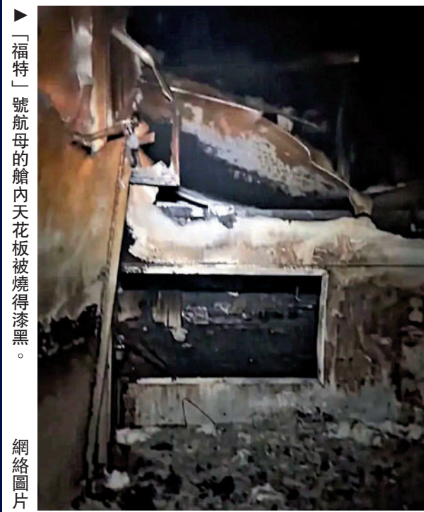
▲「福特」號航母的艙內天花板被燒得漆黑。

火災並非超長部署期間唯一發生的問題。「福特」號航母的排污系統問題也尤為嚴重，廁所屢屢堵塞。CNN的另一段視頻顯示，船上一個又一個廁所裏堆滿了排泄物。據美媒此前報導稱，「福特」號全艦約650個廁所幾乎每天都需要維修，船員上廁所排隊或需等待超過45分鐘。一名水兵描述說：