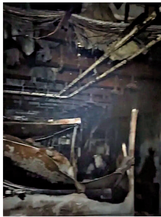
▲視頻截圖顯示，美軍「福特」號航母火災後艙內床鋪被燒得漆黑。網絡圖片