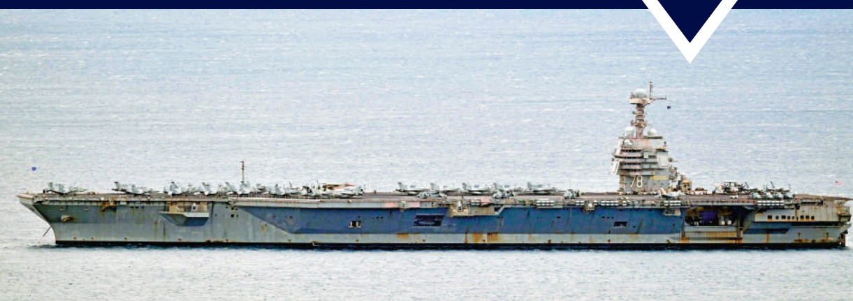
▲「福特」號航母火災後，於3月28日抵達克羅地亞進行維護。