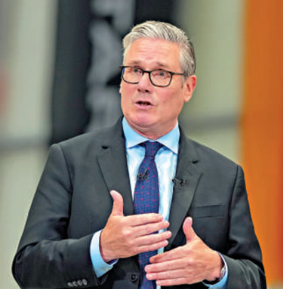
▶英國首相斯塔默4日在斯溫頓參觀一家國防科技公司時發表講話。美聯社