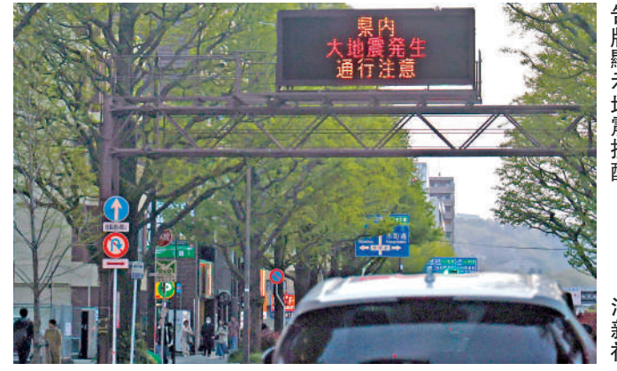
▲4月20日，日本宮城縣一處電子公告牌顯示地震提醒。

日本地震調查委員會證實，「慢滑移」現象正在三陸海域加速進行。專家指出，三陸海域的板塊邊界「慢滑移」，可能與北海道外海、根室、釧路近期的地震活動存在聯動性。東京大學名譽教授笠原順三警告說，分隔日本東西兩側的關鍵地質斷層帶「糸魚川—靜岡構造線」近期連續發生了兩次約5級地震，由於該斷層帶與南海海槽相連，將進一步增強南海海槽的地震活動，使當地出現重大地震的風險增加。