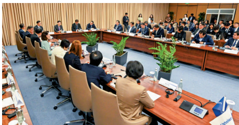
▲李家超昨日與烏茲別克斯坦數字技術部第一副部長會面。

國駐烏茲別克斯坦共和國特命全權大使于駿所設的交流餐敘。他感謝大使館一直支持香港特別行政區政府的工作，並為這次訪問作悉心安排。