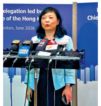
▲陳利表示，天潤以香港三維數碼地圖的標準與烏茲別克斯坦客戶對接。

針對技術本地化問題，陳利表示，香港的技術標準並非統一的通用標準，而是創新性標準。她透