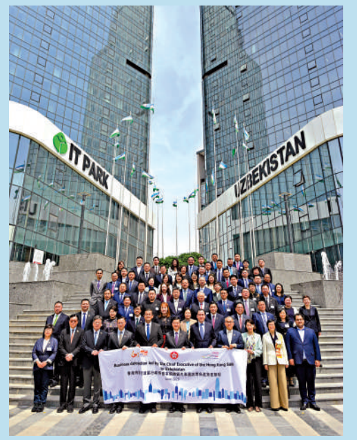
▲▲李家超昨日到訪烏茲別克斯坦 IT Park，見證 IT Park 與數碼港、香港科技园和港深創新及科技园簽署合作備忘錄，推動兩地初創培育、人才和研發等。