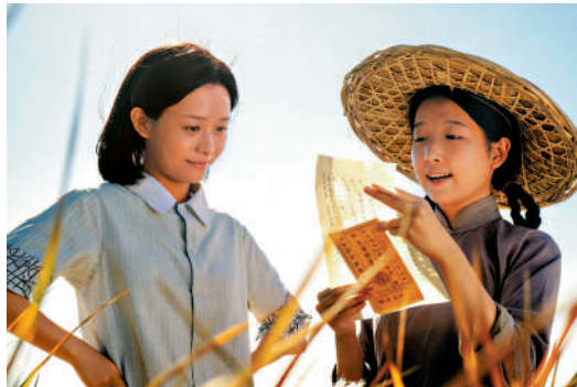
▲《給阿嬤的情書》大膽選用講地道潮汕話的素人演員出演。

據悉，《給阿嬤的情書》在中國港澳地區、新加坡、馬來西亞、文萊上映後，還將繼續拓展全球發行版圖，陸續登陸美國、加拿大、澳洲、新西蘭、英國、法國、愛爾蘭、日本、韓國、泰國、越南等更多國家及地區。