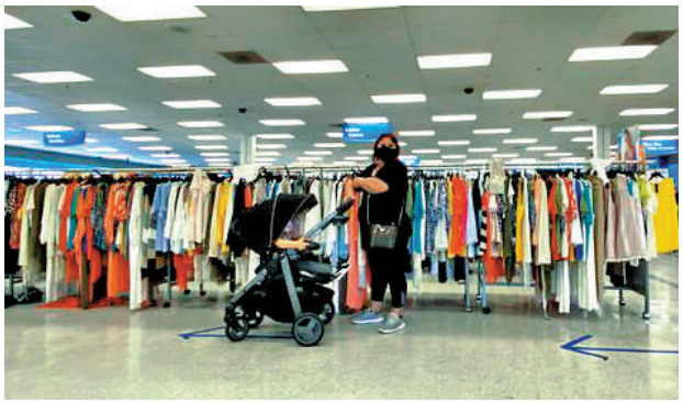
▲Ross Stores 首季收入 60.1 億美元，按年升 21%。