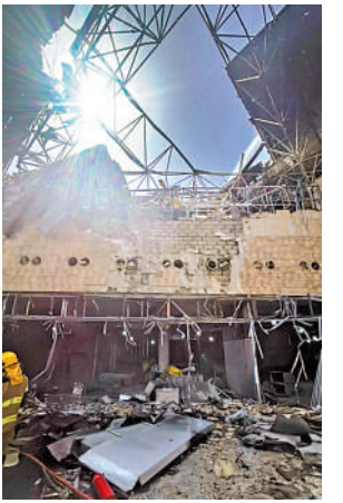
▲科威特國際機場3日遇襲，屋頂嚴重受損。