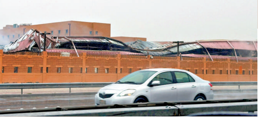
▲伊朗6日襲擊巴林的美軍第五艦隊設施。圖為伊朗無人機3月對巴林的美軍第五艦隊總部造成破壞。

當地時間6日凌晨，科威特和巴林拉響防空警報。伊朗媒體隨後報導稱，位於巴林的美軍第五艦隊總部升起滾滾濃煙。