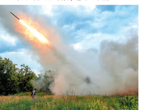
▲烏克蘭士兵在頓涅茨克州向俄軍陣地發射多管火箭炮。

聖彼得堡市市長別格洛夫6日稱，該市當天遭到大規模軍用無人機襲擊，建議市民不要外出。列寧格勒州州長德羅茲堅科指出，州防空系統共擊落144架無人機，無人機襲擊造成3人受傷。