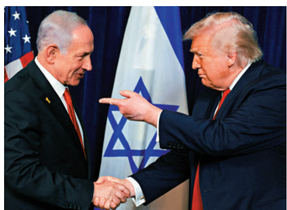
▲去年12月，美國總統特朗普與以色列總理內塔尼亞胡（左）在佛州海湖莊園會晤。

特朗普稱，「如果他（普爾特）裁員，我不會介意」，「我認為有很多人不應該在那裏」，並列舉了前總統拜登和奧巴馬任內留下的人員。