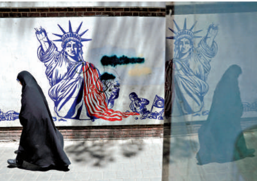
▲一名女子經過伊朗德黑蘭街頭的一幅反美塗鴉。

《時代》周刊文章認為，特朗普政府與伊朗談判能獲得的最終結果，無非是戰前原本暢通的霍爾木茲海峽重新開放，以及一項不會比2015年伊朗核協議更周密完備的核協議。美國《外交政策》雜誌直言，伊朗戰事或成為特朗普政府「最大的失敗」。