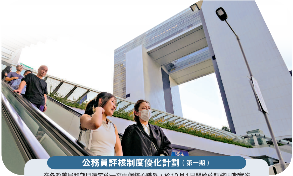
公務員評核制度優化計劃（第一期）在各政策局和部門選定的一至兩個核心職系，於10月1日開始的評核周期實施。關鍵在於各級評核人必須如實評核員工工作表現。

她表示將和局內同事會於本月中出席立法會公務員及資助機構員工事務委員會會議，全面解說優化計劃的理念和重點。