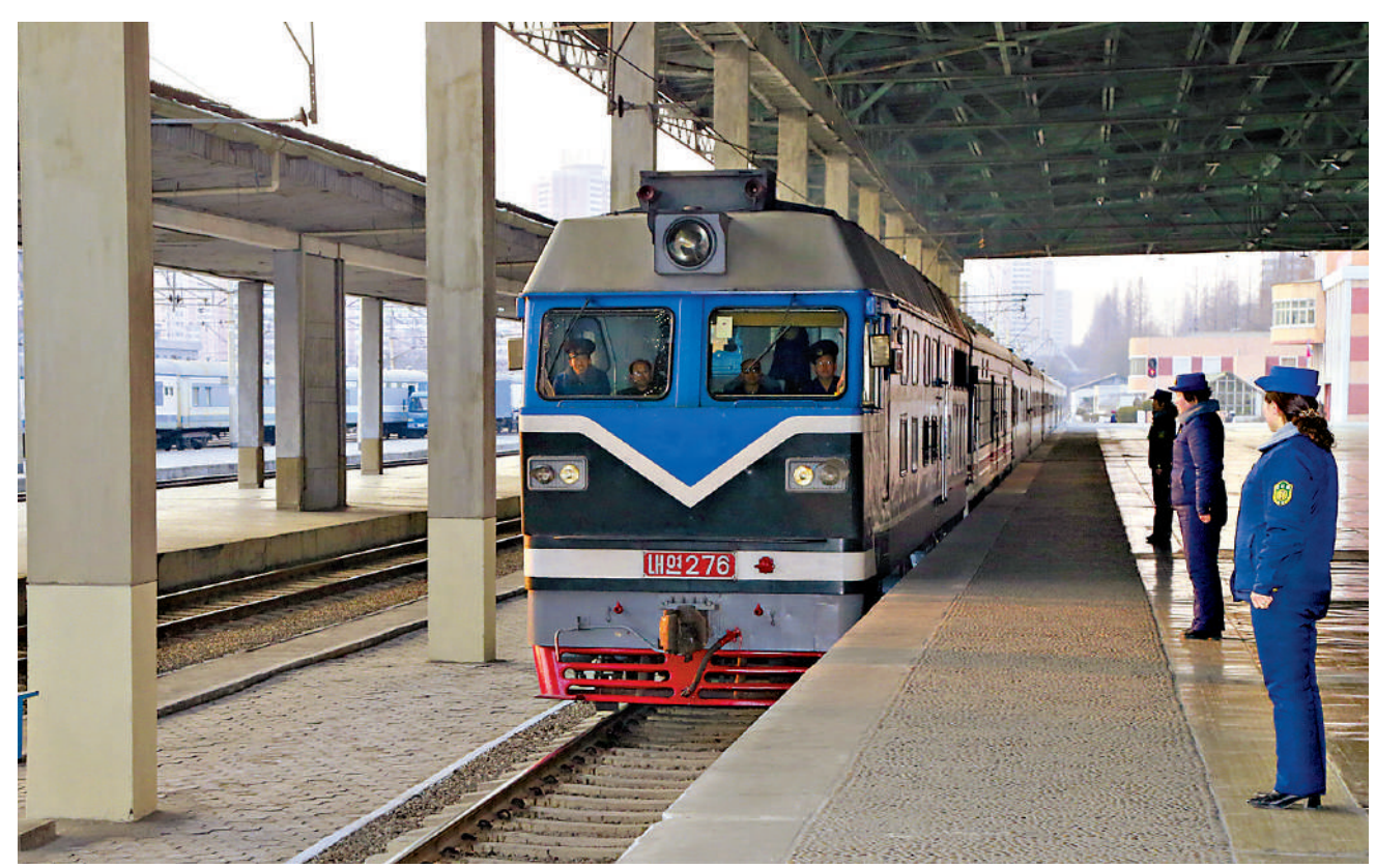
▲今年3月，中朝國際旅客列車、國航航線時隔6年復通，兩國經貿合作與人文交流迎來新的發展契機。圖為3月12日，一趟從中國丹東開往朝鮮平壤的國際旅客列車抵達平壤站。