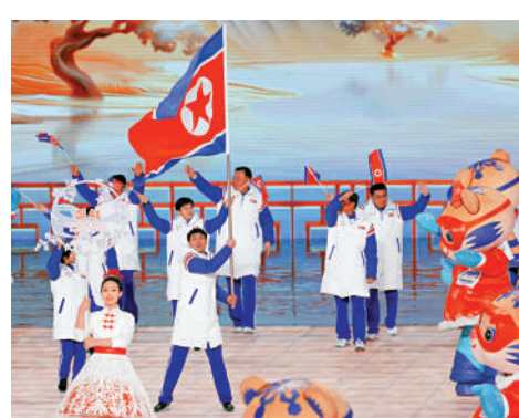
▲2025年2月7日，朝鮮體育代表團在第九屆亞洲冬季運動會開幕式上入場。

「我們有偉大的友誼，我們有共同的理想，把我們團結得無比堅強。」正如《中朝友誼之歌》中表達的那樣，站在繼往開來的歷史節點上，中朝雙方不忘初心、攜手前進，必將開啟中朝友誼嶄新篇章，共同開創兩黨兩國關係的美好未來。