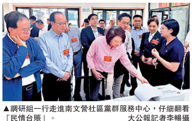
▲調研組一行走進南文營社區黨群服務中心,仔細翻看「民情台賬」。