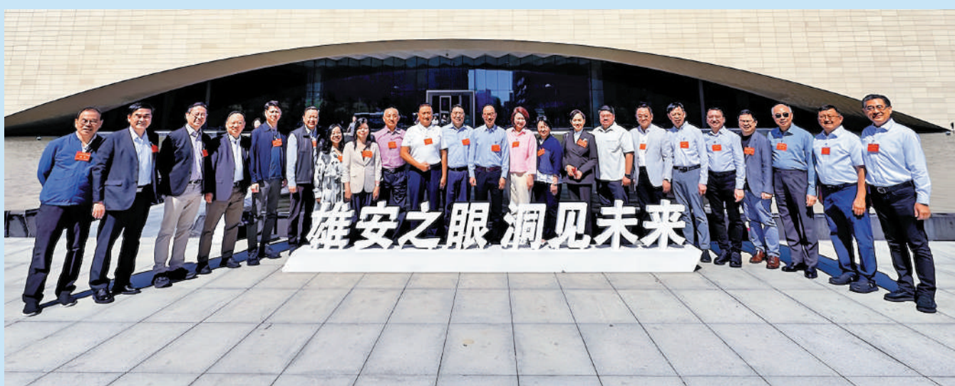
▲特區第十四屆全國人大代表專題調研組參觀雄安城市計算中心。

港區全國人大代表們紛紛表示,通過調研,對雄安新區的頂層設計、建設進展和未來圖景有了更深刻的認識,更重要的是,雄安新區高質量建設過程中有很多經驗,對香港正進行的首份五年規劃制定、北部都會區建設以及城市智能化都可提供重要借鑒。