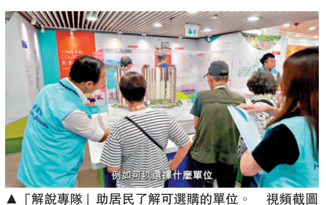
▲「解說專隊」助居民了解可選購的單位。 視頻截圖

何永賢表示,寶田邨作為房署轄下的屋邨,房署亦趁機了解大家對屋邨管理團隊是否滿意。不少街坊都直接說「非常好」,長者街坊更說「認到頭都爆」的搬屋問題,屋邨管理團隊快速幫忙解決。