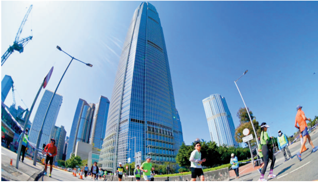
香港對接國家「十五五」規劃，須強調築牢本身的發展根基，以及鞏固和提升傳統優勢。