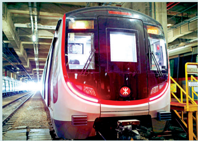
港鐵使用數據於鐵路營運，可避免不少潛在風險。