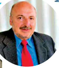
▲「三重濾網交易系統」被譽為在當代技術分析領域中，最具實用價值的技術。