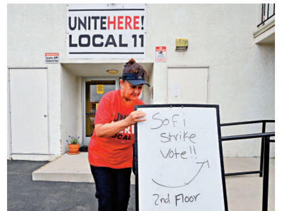
▲洛杉磯索非體育場工會6日批准罷工決議，允許場館員工在比賽期間罷工。