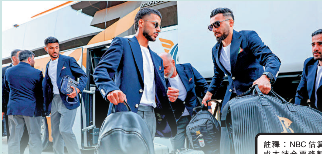
▲伊朗國家足球隊6日抵達土耳其安塔利亞機場，準備前往墨西哥。

此外，美國去年更新入境政策，來自50個被列為高風險國家的旅客申請美國簽證時，須先繳付1.5萬美元(約11.7萬港元)簽證保證金，以防止他們非法居留，該筆款項會在申請被拒或持簽證者在未違反逗留條件離境美國後退還，受影響國家包括參賽的5個非洲國家。美國政府5月暫時放寬入境限制，豁免部分持世界盃門票的球迷的保證金，但截至4月初，受新措施影響的申請者僅約250名。