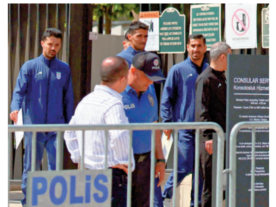
▲伊朗隊5月在美國駐土耳其大使館提交世界盃簽證申請。

阿多尼斯表示：「足球是一場盛事，而盛事需要有人觀看，美國偏離了重點。」阿多尼斯認為，一個不歡迎參賽球隊球迷的國家，不應該被允許主辦世界盃。