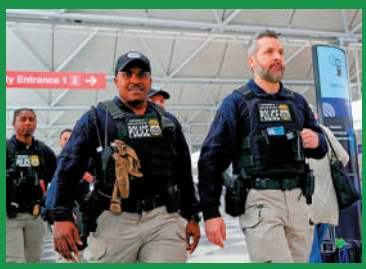
▲美國移民與海關執法局(ICE)特工3月在芝加哥奧黑爾國際機場執勤。

美國槍支暴力普遍，公眾場所的大型活動面臨極高的槍擊及社會暴力風險。世界盃舉辦城市之一的堪薩斯城市長就坦言，美國槍支威脅居高不下，將加強確保世界盃安全。