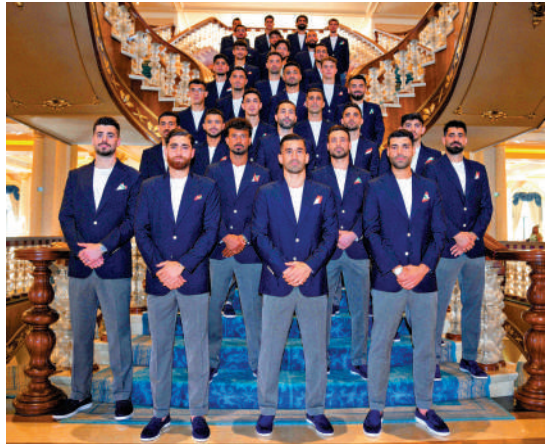
▲伊朗球員在前往墨西哥之前於土耳其安塔利亞合影。

2026美加墨世界盃定於6月11日至7月19日在美國、加拿大和墨西哥舉行。伊朗隊三場小組賽都將在美國境內進行，前兩場比賽在洛杉磯，15日對陣新西蘭，22日對比利時，接着前往西雅圖，於26日迎戰埃及。這將是世界盃歷史上，首次出現主辦國接待一支來自與其正處於戰爭狀態國家的球隊參賽。