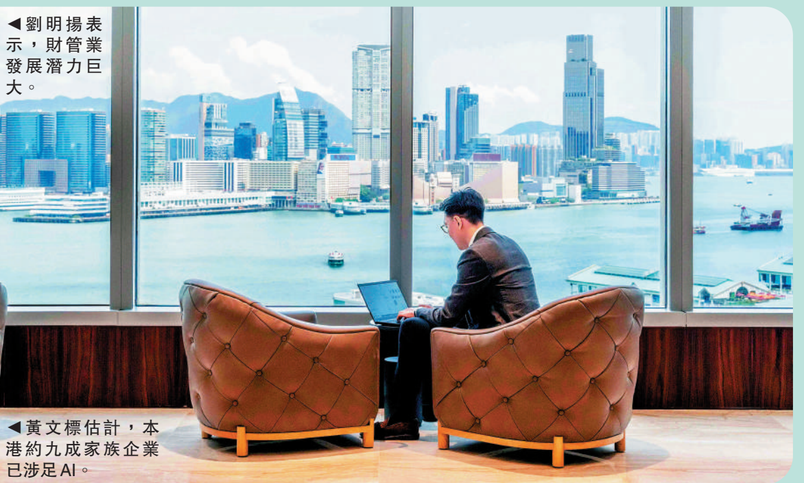
香港未來五年有望持續鞏固全球最大跨境財富管理中心地位，意味着財富管理行業發展潛力巨大。

近年，香港持續加強財富管理行業競爭力。波士頓諮詢公司（BCG）最新報告指出，2025年香港超越瑞士，成為全球最大跨境財富管理中心，管理規模達2.95萬億美元（約23.1萬億港元）。報告預計2025至2030年間，香港跨境財富管理規模增速約9%，快於瑞士的約6%，有很大機會維持全球第一的地位。