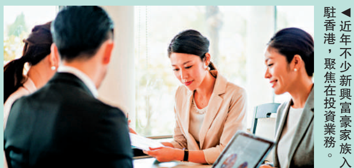
近年不少新興富豪家族入駐香港，聚焦在投資業務。