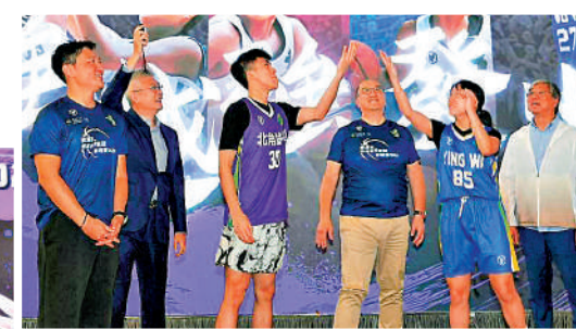
▲賽馬會青途學界籃球季前賽2026共有104隊參加。