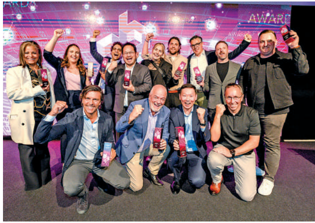
▲頒獎禮在6月3日於英國曼徹斯特奧脫福球場舉行。