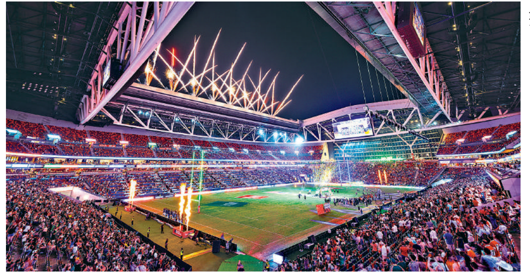
▲香港國際七人欖球賽過去兩屆均在啟德主場館上演。

自2025年3月1日開幕後，體育園迅速重塑本地體育及現場演出活動的發展生態，並成為香港的「主場」。至今，園區已舉辦近150項國際及本地大型體育與娛樂盛事，包括標誌性的香港國際七人欖球賽、世界級足球賽事等，吸引全球旅客雲集香江。