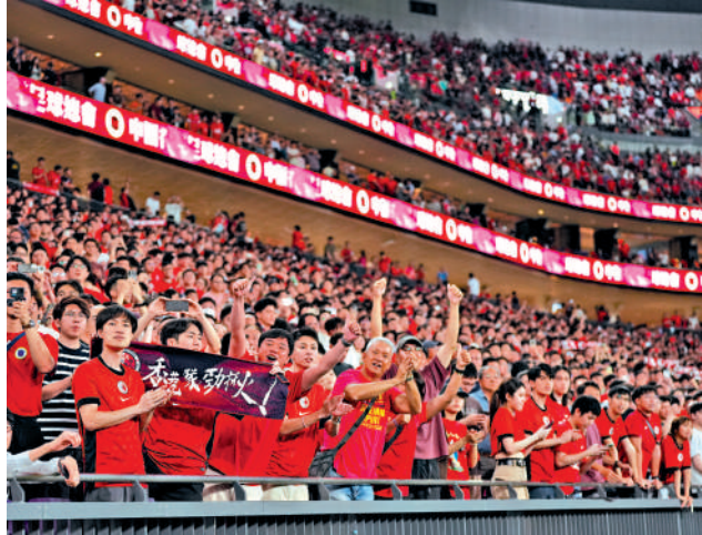
▲球迷全力為中國香港足球代表隊打氣。

【大公報訊】記者朱家立報道：啟德體育園自2025年啟用以來，已經多次獲得各類獎項。近期體育園在2026 TheStadiumBusiness Awards 榮獲「年度最佳場地」殊榮，該獎項被視為全球體育場館及盛事活動業界的最高榮譽，標誌着香港邁向國際大型盛事樞紐的重要里程碑。