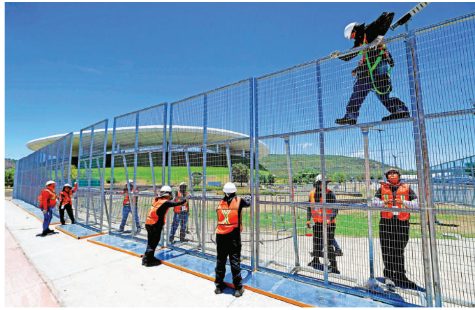
▲工人在墨西哥瓜達拉哈拉體育場為即將到來的世界盃搭建4米高的金屬圍欄。

安全部長馬林近期承認，在反無人機措施方面，「大家都有點跟不上。」據報道，美國聯邦航空局將在世界盃比賽期間，於比賽場地、球迷活動場所和球隊所在地設立「無人機禁飛區」，並強調違規者可能面臨最高10萬美元罰款、無人機被沒收以及聯邦刑事指控。美國所有世界盃比賽場館亦已安裝了反無人機系統，但因無法預知無人機的意圖，這