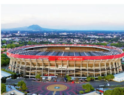
▲墨西哥城體育場將在透社日舉行揭幕戰。