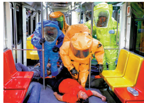
▲墨西哥6日在主辦城市之一瓜達拉哈拉舉辦安全演習。

美方此次安保工作的職責範圍廣泛，包括保障球場及球迷區安全、護送球隊及保護政要，使用的工具包括能在禁飛區向目標發射網狀物的獵人無人