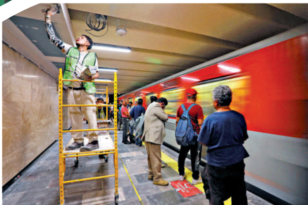
▶工人3日在墨西哥城地鐵2號線伊達爾戈站進行翻修工程。

日經亞洲網站此前稱，在比賽日，交通接駁不足可能將引發混亂。為減輕揭幕戰當天交通壓力，墨西哥政府已建議採取停課、遠程辦公等措施。墨西哥公共教育部1日發布通知，揭幕戰當天，墨西哥城公立學校停課。(新華社)