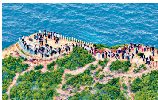
▲破邊洲吸引大批遊客到訪，當局研究引入預約制疏導。

【大公報訊】記者戴東報道：西貢破邊洲近年吸引大批遊客慕名而至，當局研究在有關路段試行預約制度，以控制高峯人流及防止山徑損耗；為避免「炒籌」，或引入實名登記制度。