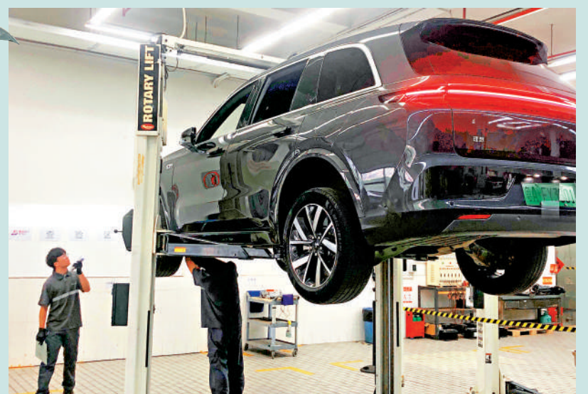
▲「粵車南下」香港市區廣東省車輛查驗點增至23個。圖為查驗點正在查驗車輛。