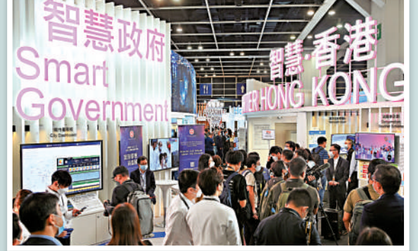
香港有不少平台供學生展現創意。圖為中學生參與去年創新科技嘉年華。▲特區政府致力建設智慧香港，以AI賦能千行百業。