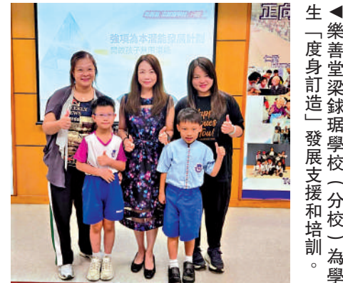
▲樂善堂梁詠瑤學校（分校）為學生「度身訂造」發展支援和培訓。

在支援架構上，學校安排主任教師擔任「成長同行者」，平均每人跟進約8名學生，透過陪伴、個人化學習任務、強項活動與內化動機四個步驟，激發學生內在動力；教師可按班級強項分布作教學調配；家長則可自願上載觀察子女的資料或語音紀錄，補充學生在校外的表現。校方同時為全體教師提供相關培訓，以提升識別學