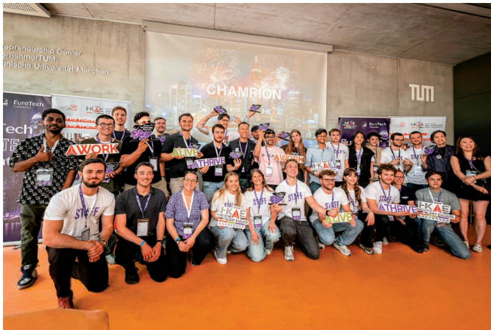
▲香港人才服務辦公室聯同德國慕尼黑創科組織舉辦創科馬拉松。

人才辦指出，2025年同類提案大賽曾安排德國得獎者到香港及深圳考察，行程包括參訪創科園區、初創培育機構及科研設施，亦與業界交流。參加者普遍認為，相關活動有助了解粵港澳大灣區的產業鏈、資金流及市場規模，部分人表示會考慮在區內尋求發展或合作機會。