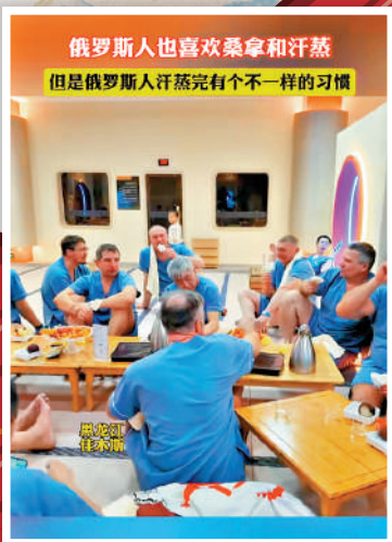
俄羅斯人也喜歡桑拿和汗蒸，但是俄羅斯人汗蒸完有個不一樣的習慣。