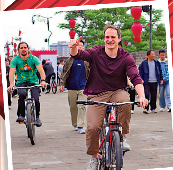
▲5月2日，外國遊客在西安城牆上騎車遊覽。