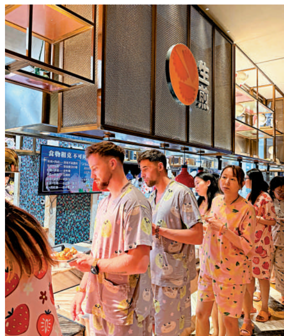
▲一站式吃喝玩樂的中式洗浴生態圈粉全球遊客。圖為外國遊客在內地洗浴中心排隊享用中式美食。