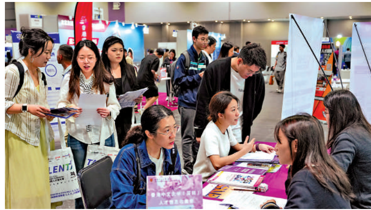
▲五年規劃將提供更多不同產業的就業機會、國際舞台和向上流空間，讓年輕一代更好實現夢想。