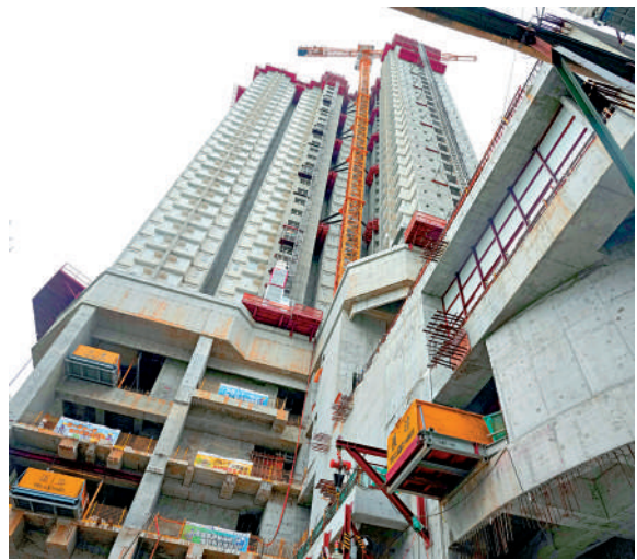
▲五年規劃有助加快香港的建設發展，市民及社會各界可在五年規劃中實際受惠。

李家超表示，由香港編制的五年規劃是歷史性的一步，是有重大意義，五年規劃會帶給市民及社會各界實際的受惠，包括：第一，鞏固和提升香港在國際金融、航運、貿易、創科等的優勢地位，加強建設國際航空樞紐、打造國際高端人才集聚高地，以及加快建設北部都會區。第二，讓香港可以抓緊更多國家戰略及發展所帶來的機遇，包括國家超大規模市場，以及經濟發展為香港所帶來的商機，國家科技及能力的分享以及「一帶一路」倡議和大灣區融合發展所帶來的機遇，涵蓋人才需求、資金流動、產業發展、就業機會及個人發展空間等。第三，有助香港更好融入及服務國家發展大局，有利於「一國兩制」的成功實踐，讓香港可以享有中國機遇及國際機遇，以及同時疊加起來發展的獨特優勢，發揮內聯外通的橋樑作用，推動高質量發展，讓市民共享更多發展紅利。