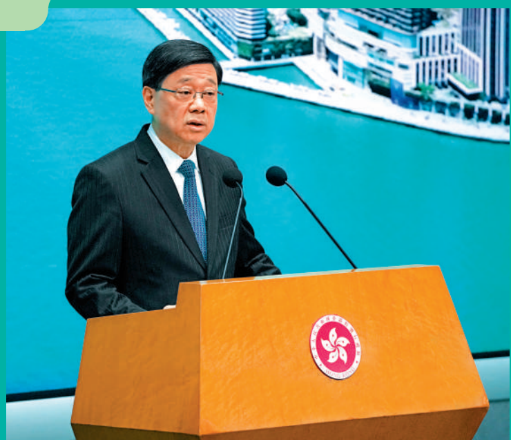
▲李家超昨日宣布，特區政府將會在下周一（15日）發表公眾諮詢文件，展開為期兩個月的公眾諮詢。