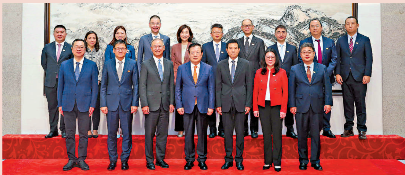
▶中央港澳工作辦公室主任、國務院港澳事務辦公室主任夏寶龍，昨日在北京會見香港銀行公會代表團一行。

【大公報訊】6月9日上午，中央港澳工作辦公室主任、國務院港澳事務辦公室主任夏寶龍在北京會見香港銀行公會代表團一行。 中央港澳工作辦公室、國務院港澳事務辦公室分管日常工作的副主任徐啟方參加會見。