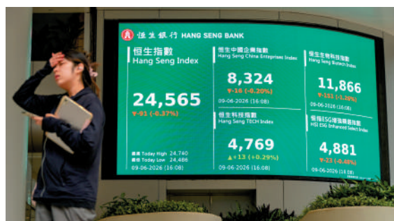
▲港股連續5个交易日下跌，短期震盪風險不容忽視，但中長期優質資產仍值得投資。

6月、7月及9月、10月是兩個值得警惕的時點。今年夏季最值得警惕的是「夏日寒風」，由一隻「灰犀牛」及三隻「黑天鵝」導致。美伊衝突令霍爾木茲海峽航運秩序異常，持續越久對供應衝擊越大，美債長端利率大概率明顯上行。